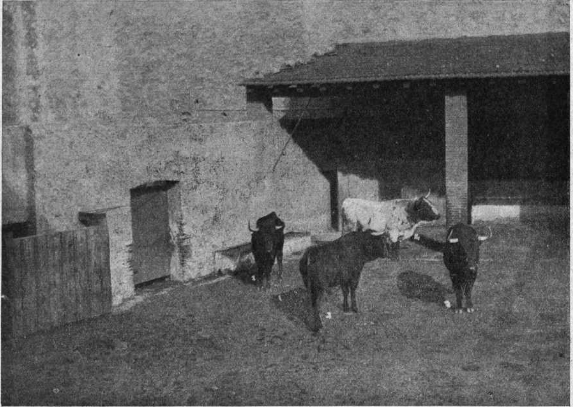
Los cuatro toros del Sr. Cámara en los corrales de la plaza.

Cuatro toros en todo el valor de la palabra, como no solemos ver en corridas de alto precio.