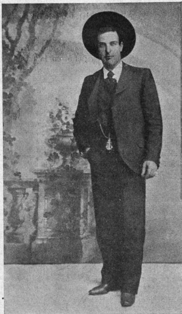
José García, Algabeño , en traje de calle.