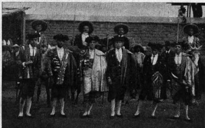
Cuadrilla de Jóvenes Mexicanos.