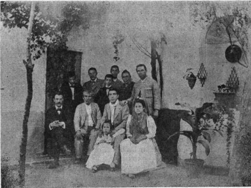
En casa de Parrao .

tranquilizador para el empresario, que seguramente querría ver más gente en los tendidos; pero el año anda malo y las entradas por las nubes, y de ahí que se llaman á engañar los feriantes.