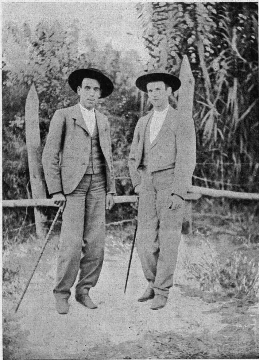
Montes y Bombita chico la víspera de la corrida, en Tablada y á orillas del Guadalquivir.

Montes y Bombita chico lo han conseguido, y de ellos son las glorias.