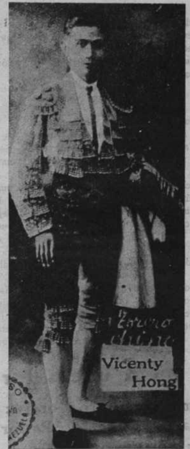
El torero chino en traje de "faena" que sabe vestir con el mismo garbo que un torero de Triana.

En la firmeza con que nos ha prometido lograrlo hemos adivinado una voluntad de