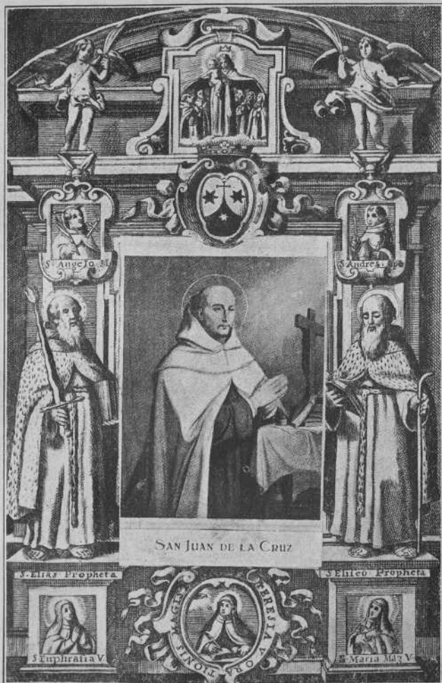
ALBUM POETICO ILUSTRADO DE S. JUAN DE LA CRUZ