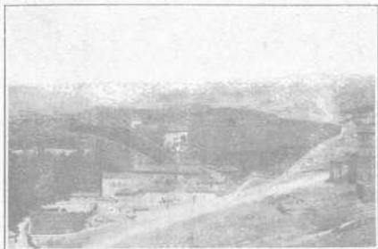
Vista del convento, huerta y ermitas.