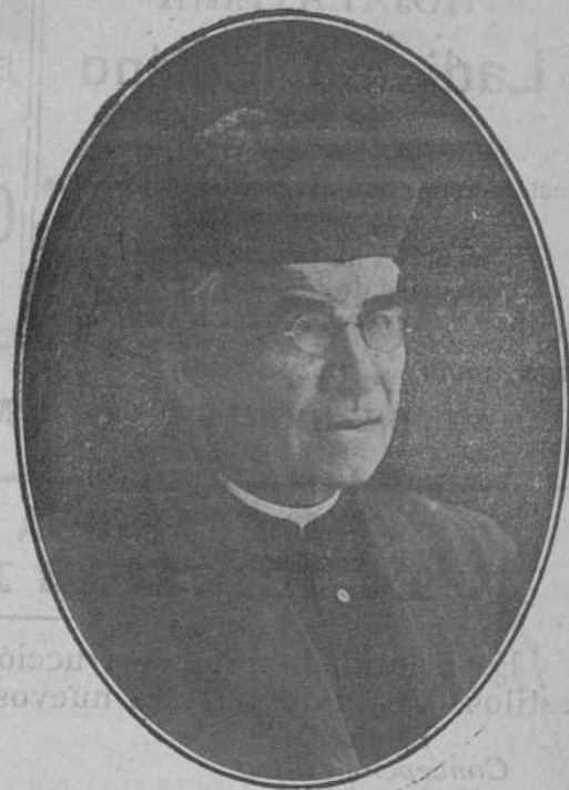
El maestro, en su diaria ascensión al Sacro Monte para dar las clases y socorrer a los pobres. Último retrato del venerable anciano que ennobleció las carreras del sacerdocio y del magisterio, honrando a la patria.