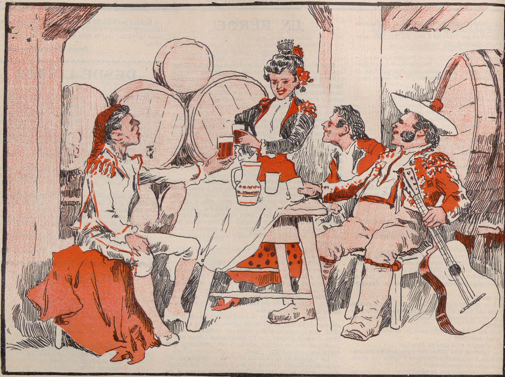
Una juerga torera antaño.