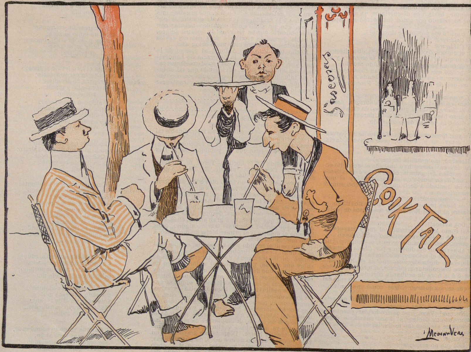
Como se divierten los toreros ahora.