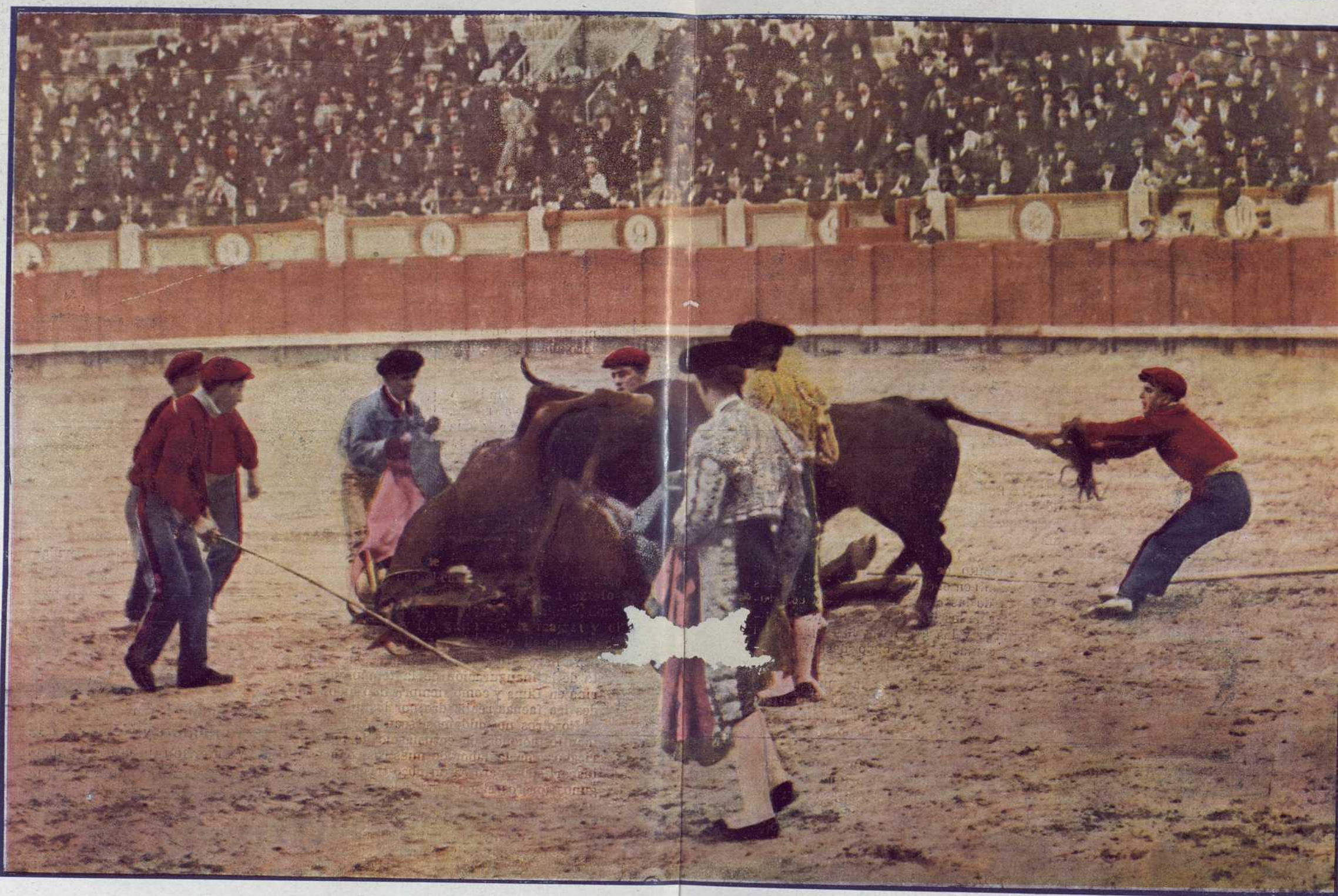
UNA CAIDA DE PELIGRO