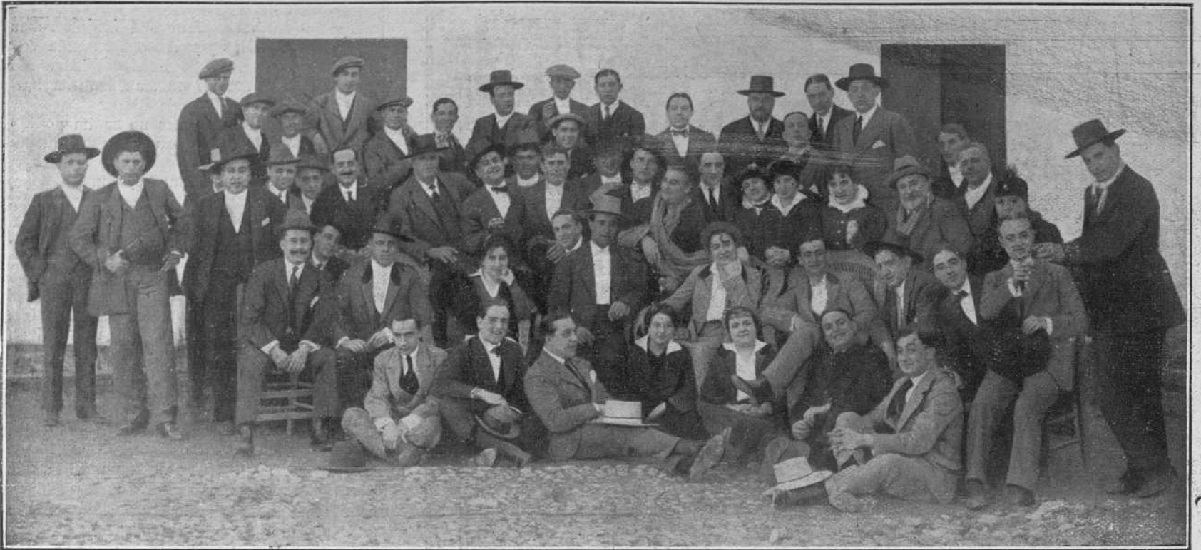
Grupo de los asistentes á la fiesta que dió Gallito en obsequio á la Xirgu.