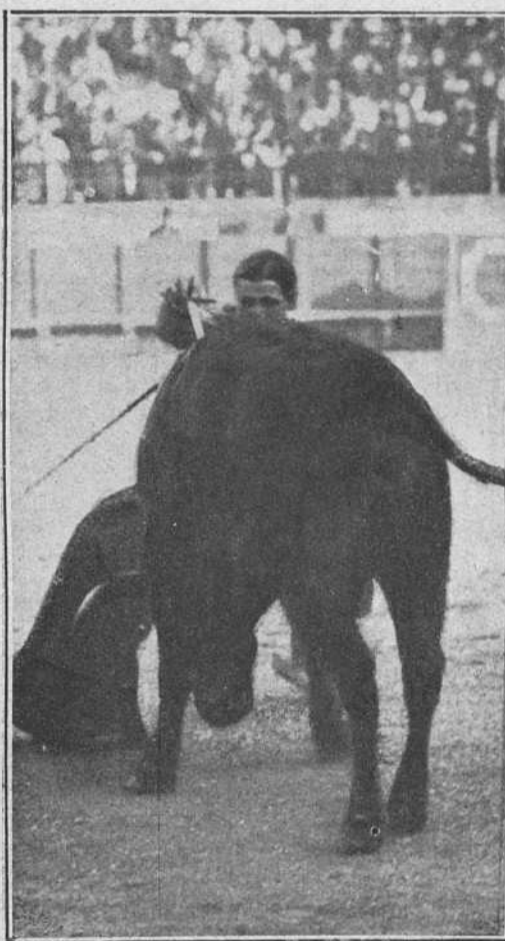
Juan Belmonte en la misma corrida.

Si la fisonomía del bicho era de respeto, los hechos no guardaron relación con aquél: pues en varas, aunque cumplió como por aquí se ve pocas veces, tomando cuatro varas con voluntad