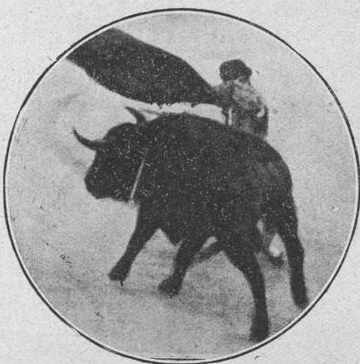
Valencia el domingo en Madrid.

—Casi, casi. —¿Cómo no torea usted que tanto vale? —¡No sé! Desgracia, fatalidad. ¡No sé! Algo. Alguien me apuntó cerca de mí: —¡Sí; todo eso y algo peor! Abandono, no preocuparse de lo que nada le sirve, olvidar la profesión dedicándose a otros menesteres que hacen decaer el espíritu y la materia.