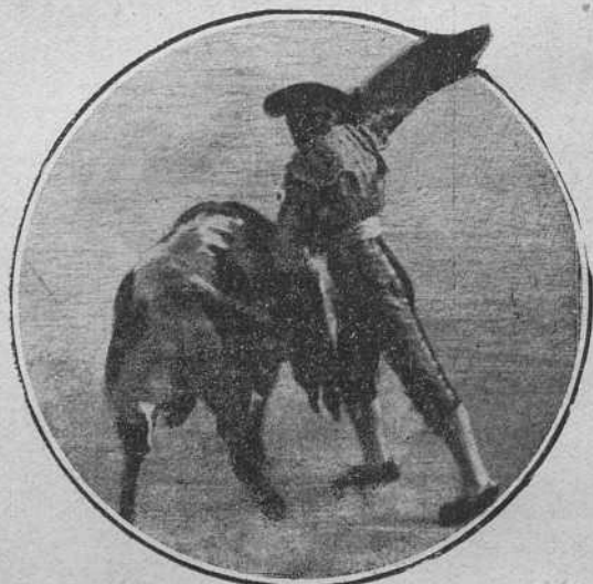
Rodalito en la misma corrida.