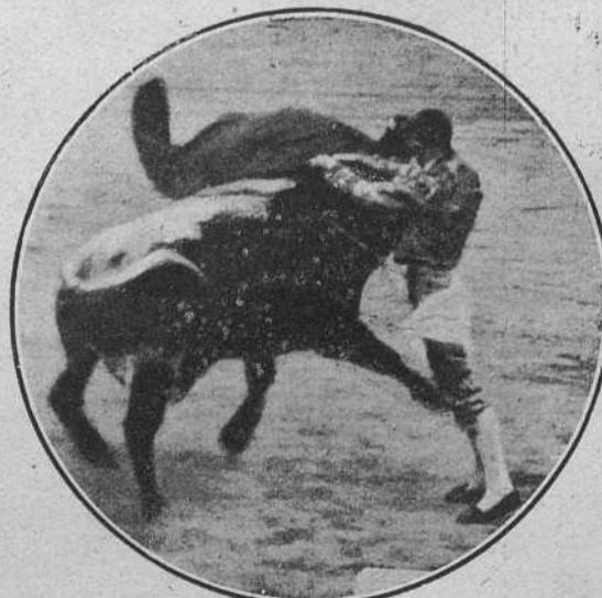
Cotera el 2 en Barcelona.