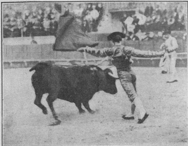
Camará el 2 del corriente en Córdoba.