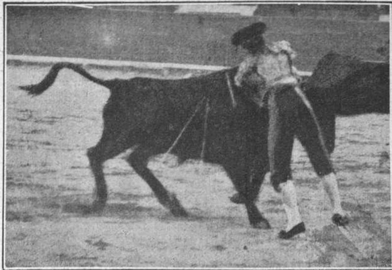
Casielles el 2 en Barcelona.