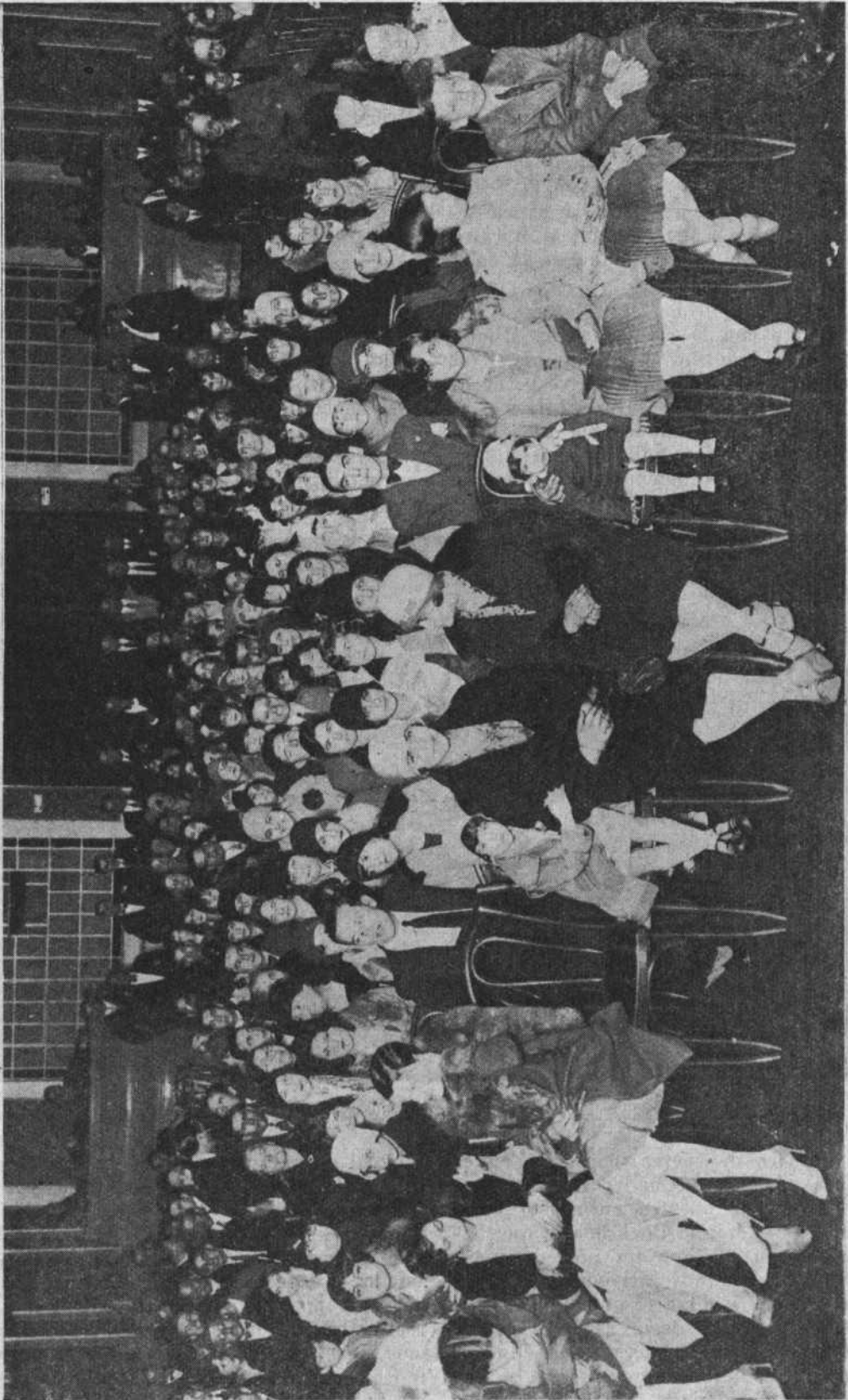
DURANTE LA VELADA DEL 8 DE JULIO - UN ASPECTO DEL SALÓN