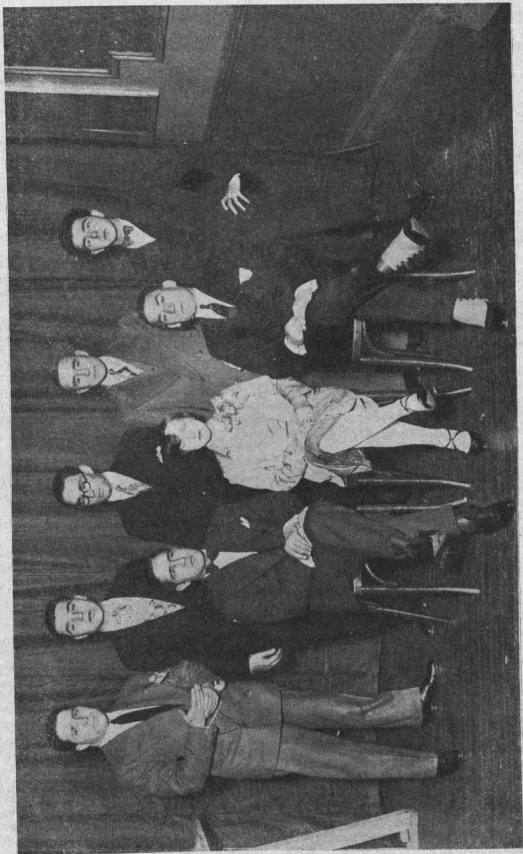
ELEMENTOS DEL CUADRO ESCÉNICO QUE TOMARON PARTE EN LA VELADA DEL 8 DE JULIO