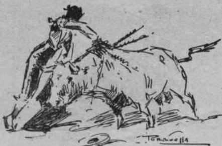
Lagartito entrando a matar