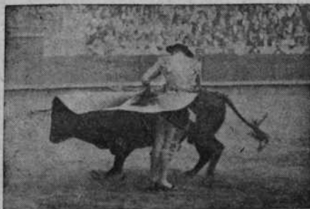
Lagartito en una media verónica

corretón, tomándolo al principio Félix con cierta apatía y enmendándose después. Acu-