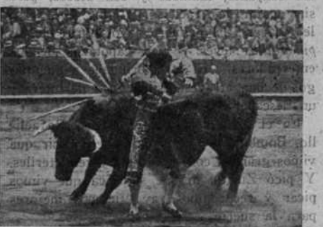
Belmonte en un molinete

Con el primer toro hizo el ridículo el novillero Rafaelillo (Rafaelillo, el malo). Y