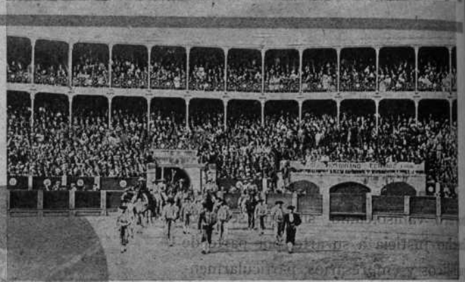
Vista interior de la misma en hora de corrida