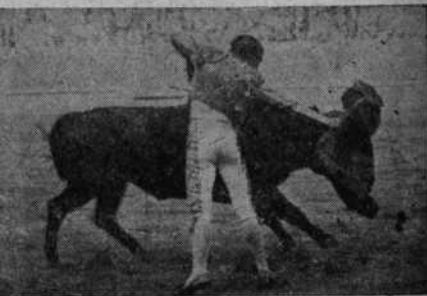
Lagartito toreando al natural

Reasumiendo en el cuadro de honor pondremos: