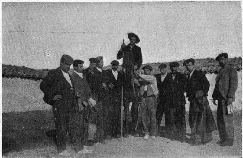
Personal de t h ienta.

De las elegidas, nueve fueron calificadas como superiores, tres como buenas y cuatro como regulares.