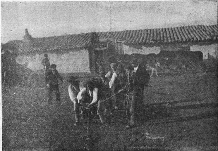
Acto de enlazar á un becerro para herrarlo.

El 24 se tentaron 47 becerros de sobreañío, de los cuales resultaron ocho superiores, cinco muy buenos, 19 buenos y seis regulares.