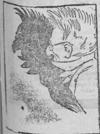
EL PAPA GAYO