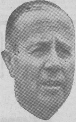
Por PEDRO ESCARTIN