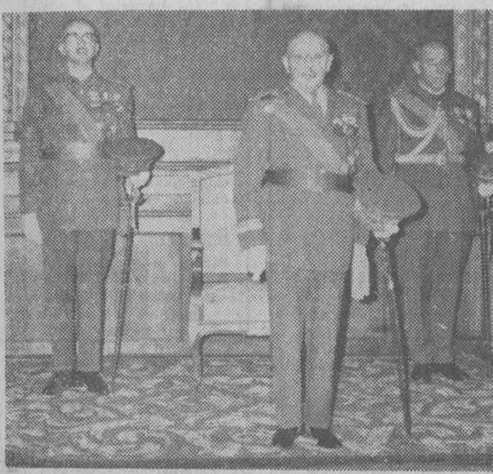
Con motivo de la Pascua militar hubo ayer, en Capitanía, la anual recepción castrense, en la que «Fede» obtuvo la precedente placa del capitán general de la región, teniente general Pérez-Soba, en el estrado del salón del Trono durante dicho acto.