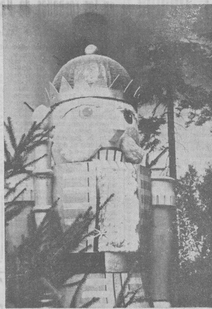
Este gran cascanueces decorado como un Rey Mago puede admirarse estos días a la entrada del Museo de Juguetes de Seiffen, en Berlín. A lo largo del año, más de 130.000 personas, en su mayoría niños, visitan este museo donde se exponen más de siete mil juguetes de todo tipo y procedencia.