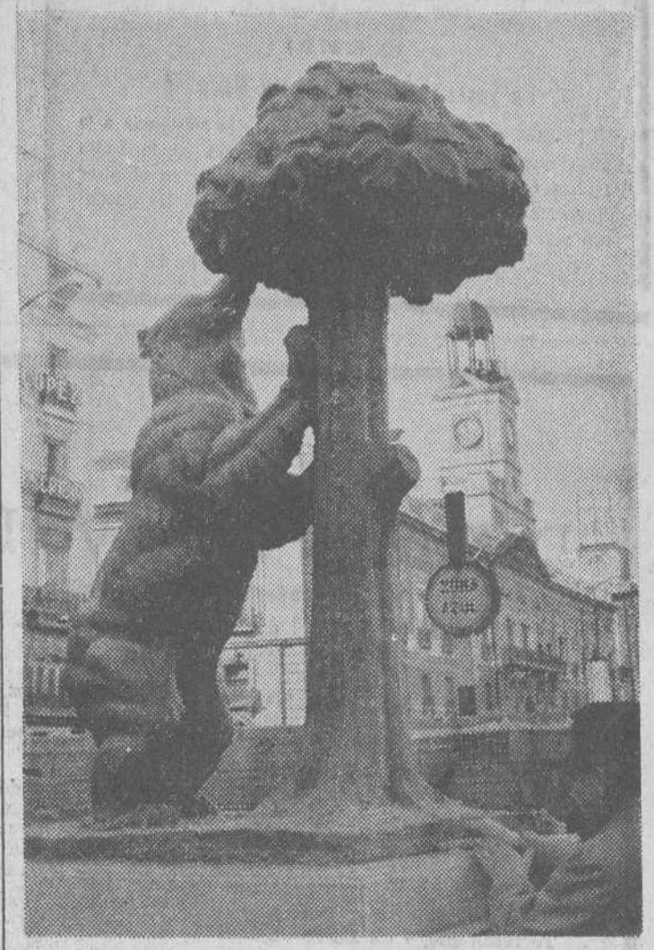
Ha sido ya instalada en la Puerta del Sol de Madrid, a escasos metros del kilómetro 0 de España (punto desde el que se contabiliza el kilometraje de todas las carreteras nacionales por estar considerado el centro geográfico de la Península) la estatua del Oso y el Madroño, símbolo de la capital española, que figura en el escudo heráldico de la misma. Su autor es el destacado escultor don Antonio Navarro Santa Fe. La fotografía está obtenida durante su instalación, ya que no será oficialmente inaugurado el monumento hasta dentro de unos días.