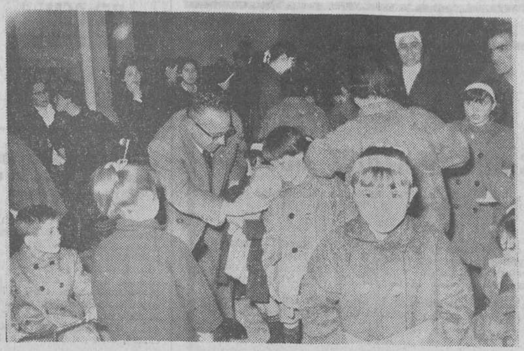
A mediodía de ayer se celebró, en los Establecimientos provinciales de Beneficencia, una simpática fiesta en la que se entregaron a los pequeños acogidos en dicha institución los juguetes y obsequios que dejaron los Reyes Magos, para ellos, a su paso por nuestra ciudad. — En nuestro grabado, un momento de la distribución de juguetes.