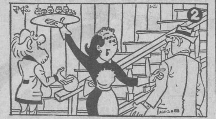
Estos dos dibujos son aparentemente iguales. Siete diferencias los separan. Si es usted buen observador debe descubrirlas antes de cinco minutos. (La solución mañana)