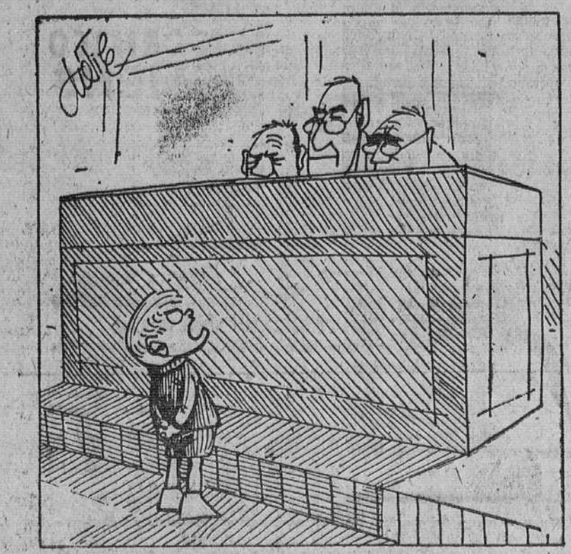
—¿Como! ¿Ahora resulta que lo piden todo de memoria?