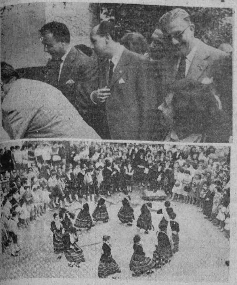
Nuestras autoridades y varios cientos de burgaleses residentes en Madrid acudieron el sábado al pabellón de Burgos de la V Feria Internacional del Campo.

Fue seguida con el mayor interés la actuación del laureado Orfeón Burgalés, que ofreció un magnífico recital de danzas y canciones en el patio del pabellón y recibió cálidos aplausos.