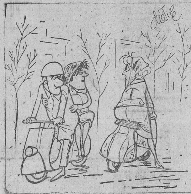
—Te conviene casarte. Se pasa mucho menos frío en la vespa.