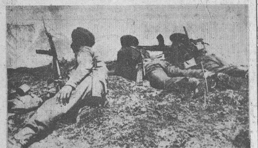
LAS TROPAS INDIAS COMBATEN Leh (India). — Las tropas indias combaten en el valle de Leh, capital de Ladakh. En la foto una patrulla india se dispone a hacer frente a la agresión de los carros comunistas chinos.

Antiguamente existía en este pueblo el impuesto llamado «a libro», mediante el cual cada vendedor pagaba diariamente una libra del género que expendía. Pero este impuesto fue suprimido por disposición real hace más de ciento cincuenta años.