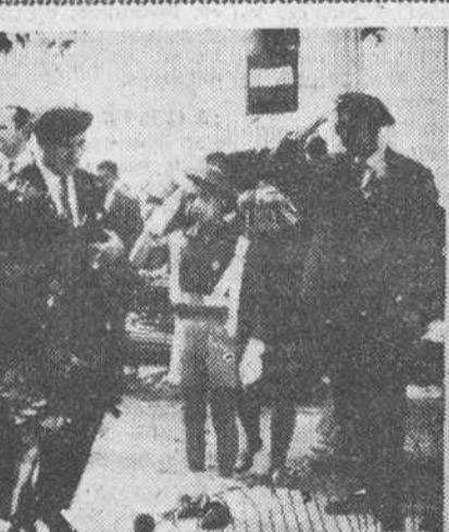
Los requetés caídos

En un comentario acerca de las conversaciones que el ministro marroquí de Asuntos Exteriores, Sid Ahmed Balafrej, está celebrando en Madrid, la agencia dice que los trabajos diplomáticos existentes entre los dos países garantizarán una fructífera cooperación entre los dos go-