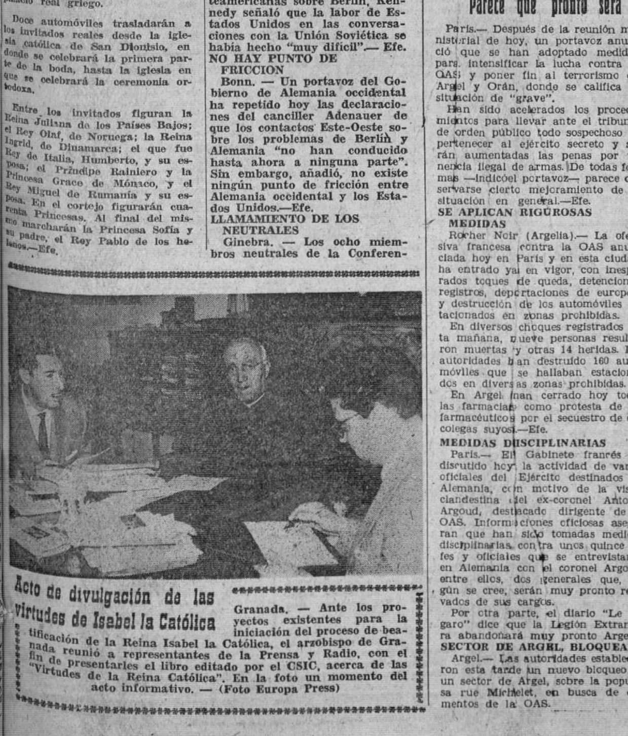
Granada.—Ante los proyectos existentes para la iniciación del proceso de beatificación de la Reina Isabel la Católica, el arzobispo de Granada reunió a representantes de la Prensa y Radio, con el fin de presentarles el libro editado por el CSIC, acerca de las "Virtudes de la Reina Católica". En la foto un momento del acto informativo.