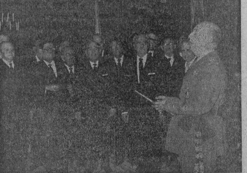
Madrid.—S. E. el Jefe del Estado y Generalísimo ha recibido en audiencia militar y civil en el palacio de El Pardo a los siguientes señores.

Ofrenda al Caudillo de la presidencia del IV Congreso Mundial de Carreteras