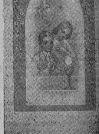
Secreto y moderno surtido de estampas en TALLERES GRAFICOS "DIARIO DE BURGOS" Vitoria, 13. — Tel. 2852 Apartado, 46