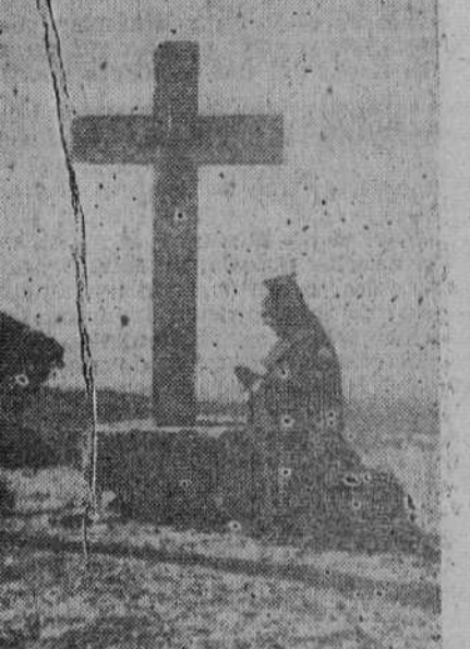
Via-Crucis en los alrededores del santuario franciscano de La Aguilera.