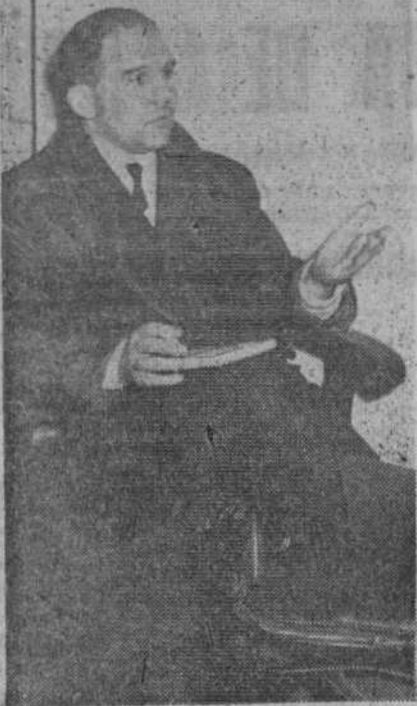
Este es el joven y dinámico periodista francés que ha venido a la tierra del Cid.