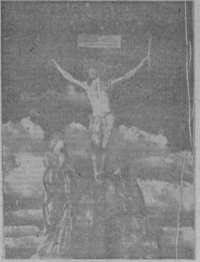
“Jesús Crucificado”, uno de los más expresivos y patéticos “pasos” que figuran en los desfiles procesionales de la Semana Santa burgalesa.