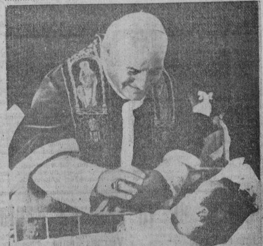
En sus salidas por Roma, en las audiencias que cada día concede, Juan XXIII, el padre por excelencia, lleva el consuelo de su afecto a los hijos débiles y enfermos.

ningun amante de la tierra ha sabido, ni ha podido darse. «Tomad y comed», dijo en la víspera de su muerte. Y qué nos daba? Su cuerpo en alimento y su sangre en bebida y con su cuerpo y su sangre, su alma y su divinidad, para incorporarnos a Él y hacernos uno con Él. Que éste es el ideal del amor, la unión de los corazones, la unión de las vidas, la unión de los seres. Esta es la meta y éste es el ápice del amor fraterno, cuya realización plena y completa sólo podrá obtenerse en el cielo, es verdad, pero que ya puede tener un anticipo aquí en la tierra, como ya la tuvo entre los primeros cristianos, de los que nos dice el Libro de los Hechos de los Apóstoles, que tenían un solo corazón y una sola alma, sin que hubiera entre ellos ninguno con necesidad porque se daba entre ellos la comunicación generosa de bienes. Y este anticipo lo tendrá también entre nosotros si, no contentos con dar al hermano necesitado de nuestro pan, de nuestro vestido, de nuestro dinero y de todas nuestras cosas, nos damos a él y a todos los hombres con la luz de nuestra inteligencia, el sentir del corazón y la vida entera de nuestra alma. En una palabra, al ejemplo de Jesucristo, no solamente les damos de nuestros bienes, sino también a nosotros mismos. Pero el amor de Jesucristo a los hombres no se sintió satisfecho con todo este cúmulo de dones. Tenía que darse a sí mismo y se dio como