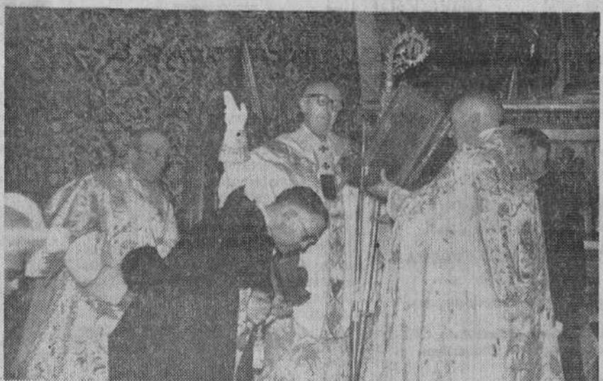
Pascua de Resurrección en la S. I. Catedral

Ciudad del Vaticano.—A media noche del sábado, las campanas de las iglesias repicaron en toda Italia después de haber permanecido en silencio durante tres días. Su Santidad el Papa celebró el domingo una solemne misa de pontifical en la basílica de San Pedro para celebrar la Resurrección de Cristo. Cuando el Padre Santo impartió su bendición quintas palabras fueron soltadas en la plaza ante a la basílica. Después Su Santidad desde el balcón principal del palacio vaticano hizo un llamamiento en favor de la paz. Unas cien mil personas estaban congregadas en la plaza de San Pedro y numerosos grupos peregrinos se hallaban también en la monumental plaza en la mañana de cielo cubierto. La ceremonia fue televisada por «Eurovisión».