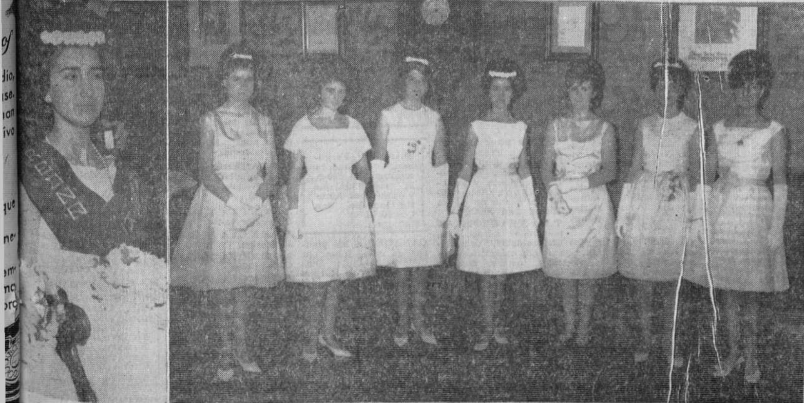
Proclamación de la «Reina» y «Corte de Honor» de la Tuna estudiantil de los Kostkas

BENDICIO AYER A 1.000 PERSONAS.—Su Santidad Juan XXIII se ha asomado al balcón que domina la plaza de San Pedro para impartir bendición a unas 30.000 personas congregadas en ella. Una bendición que desató a tonitruosamente unas «Felices Pascuas».—Efe.