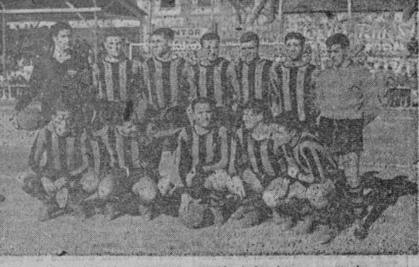
El equipo del Sestao, que reapareció el domingo en nuestro campo, inaugurando los partidos del trofeo Di Stefano.