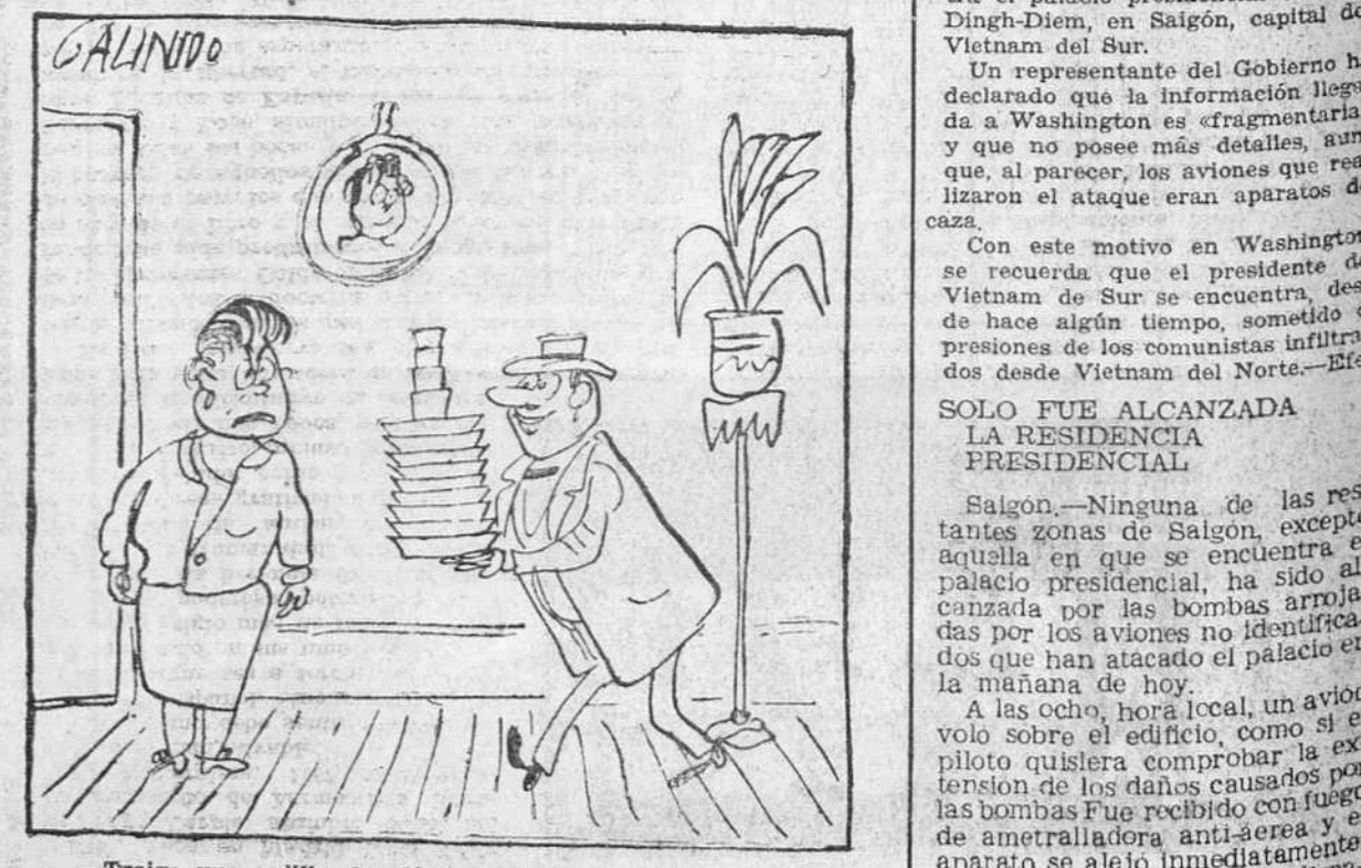
—Traigo una vajilla de plástico. Desde hoy, podremos volver a reñir todos los días a la hora de las comidas.