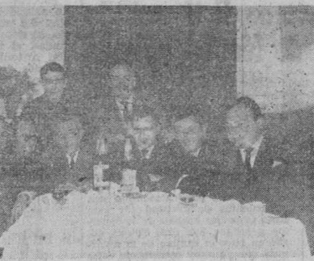
LOS CORRESPONSALES DE PRENSA REUNIDOS EN ACTO DE HERMANDAD.