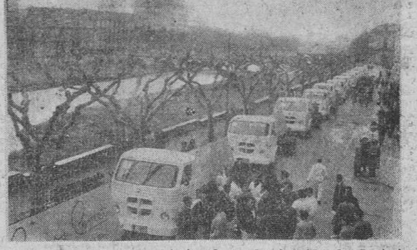
La caravana "Pegaso", estacionada en la Avenida de Sanjurjo, momentos después de su llegada a nuestra ciudad.

Con tal motivo "ENASA" ofreció una recepción en el hotel Condestable