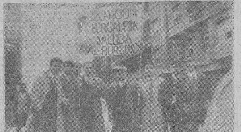
"Hinchas" burgaleses en la capital vizcaína, con una pancarta de salutación, exhibida en el campo de Garelano.

El once burgalés volvió a fallar como conjunto y estuvo falto del mordiente necesario en el ataque