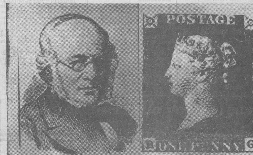
Sir Rowland Hill, fue el reformador del sistema de Correos por Ley, reforma que presentó en el Parlamento inglés en 1840, introduciendo o cimentando de esta forma el sello de Correos. En la «foto» le vemos a la izquierda en un grabado de la época, junto a un sello (derecha) que apareció por primera vez el 6 de Mayo de 1840, de un penique de valor, y del cual se vendieron el primer día un millón de ejemplares.—(Foto fiel)