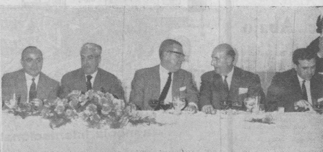
Ayer celebraron su fiesta anual los Cuerpos de ingenieros y peritos industriales. En nuestra «foto» presencia de la comida de hermandad, en la que se reunieron los componentes de los respectivos Colegios, presididos por el ingeniero jefe de la Delegación de Industria.