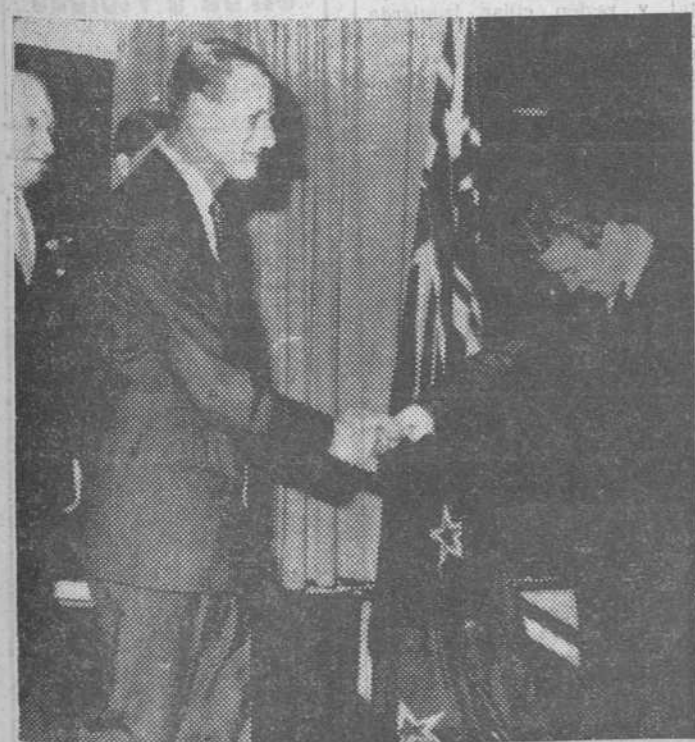
Con una ceremoniosa inclinación de cabeza y una sonrisa en los labios, Lord Snowdon, esposo de la Princesa Margarita, saluda a su cuñado el Príncipe de Edimburgo, a la llegada de éste a la Casa de Nueva Zelanda, de Londres, donde había de entregar su premio de Diseño Elegante 1965. Lord Snowdon se encontraba allí por ser consejero de la Organización o Consejo de Diseñadores Industriales.