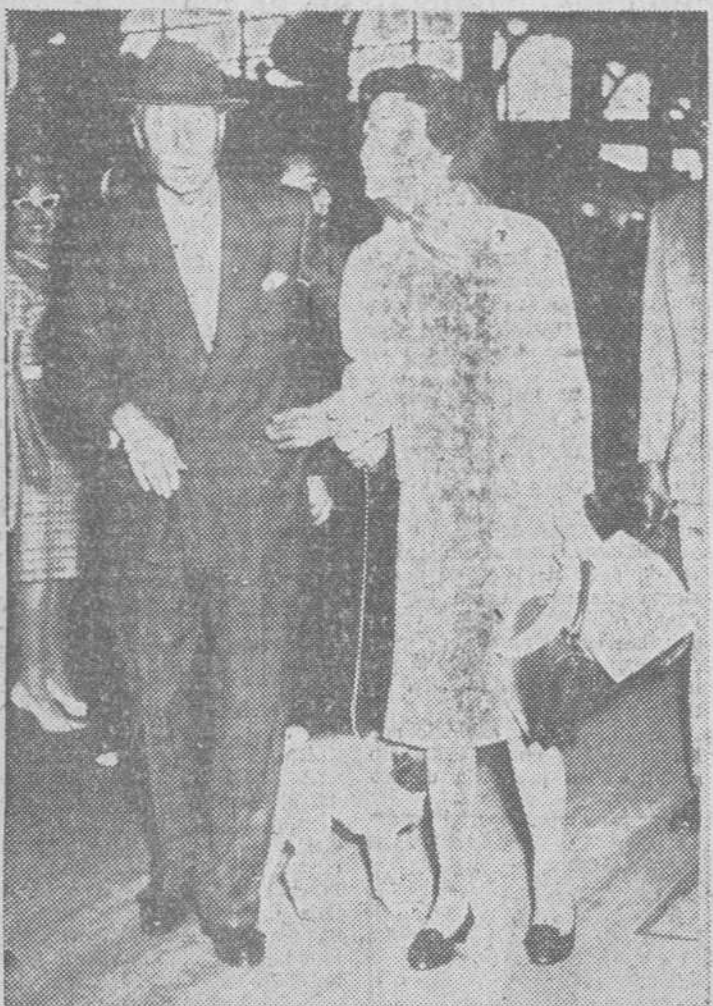
—He elegido París para celebrar este acontecimiento (su 70 aniversario) porque de todas las ciudades del Mundo es la más cercana a mi corazón...

Panorama semanal de la economía española