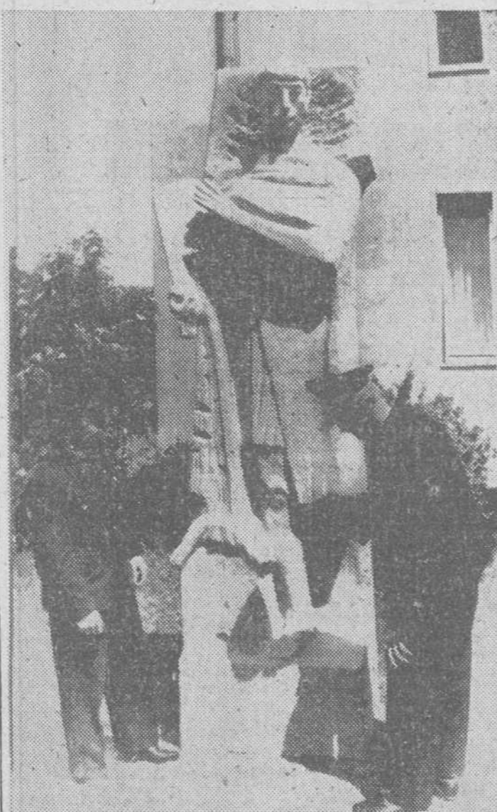
En Wuerzburg existe, quizá, una de las pocas estatuas dedicadas al Santo patrono de los bomberos. En la «Foto» los alumnos de la Escuela de Bomberos de la localidad, contemplan la estatua de San Florián, representado arrojando un cubo de agua.