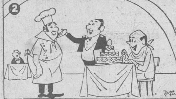
Estos dos dibujos son aparentemente iguales. Siete diferencias los separan. Si es usted buen observador debe descubrirlos antes de cinco minutos. (Solución, mañana).