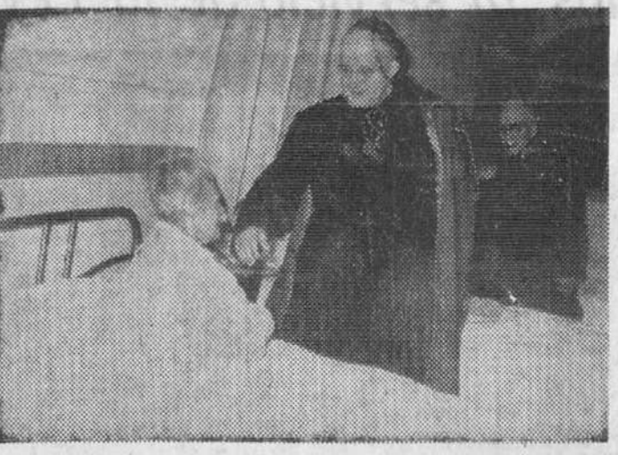
Nuestro Rvdmo. Prelado quiso visitar, también, a los ancianos del Asilo de Hermanitas que se encontraban en el lecho del dolor, con quienes conversó paternalmente. — En nuestro grabado, un momento de dicha visita.

El Prelado bendijo la comida en la Cocina de Caridad