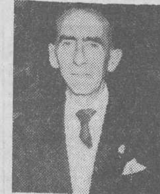
PALABRAS DEL ALCALDE DE SALAS

Terminada la intervención del vicesecretario provincial de Ordenación Económica, el alcalde de Salas pronunció unas palabras indicando la profunda preocupación de los pueblos de la comarca por la situación en que se encuentran, y manifestando a la vez su esperanza en los resultados positivos de este Consejo. Agradeció la presencia del gobernador civil y demás personalidades y solicitó de los reunidos fuese aprobada una moción expresando los sentimientos de lealtad e inquebrantable adhesión al jefe del Estado de la comarca de Salas, moción que fue aprobada por unánime aclamación.