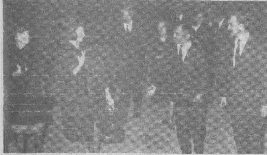
Amman (Jordania). — El Príncipe don Juan Carlos de Borbón y su esposa, la Princesa doña Sofía, a su llegada a Amman son recibidos por el Rey Hussein de Jordania y la Princesa Muna.