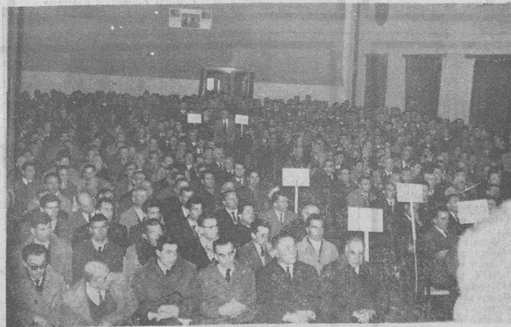
En la histórica ciudad de Salas de los Infantes se celebró el domingo la clausura del Consejo económico sindical de aquella comarca, cuyo acto final fue presidido por el gobernador civil, acompañado por el vicesecretario nacional de Ordenación económica y otras autoridades y personalidades. — En nuestro grabado, aspecto que ofrecía el cine donde se celebró la sesión de clausura. — (Información, en séptima página).