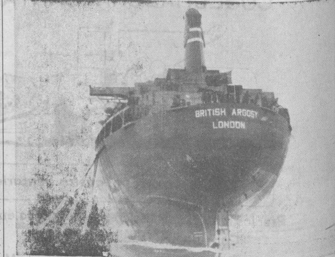
Uno de los más grandes petroleros construidos en Gran Bretaña, el «British Argosy» de 100.000 toneladas de peso muerto...