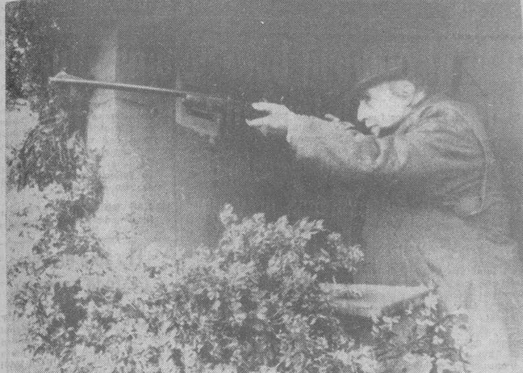
Bajo una lluvia torrencial, y un tiempo desapacible y hosco, se celebró en los montes de El Pardo una montería a la que, invitadas por S. E. el Jefe del Estado, asistieron numerosas personalidades del Gobierno y de la vida económica y cultural del país. — En la foto vemos al Generalísimo despidiendo desde su puesto.