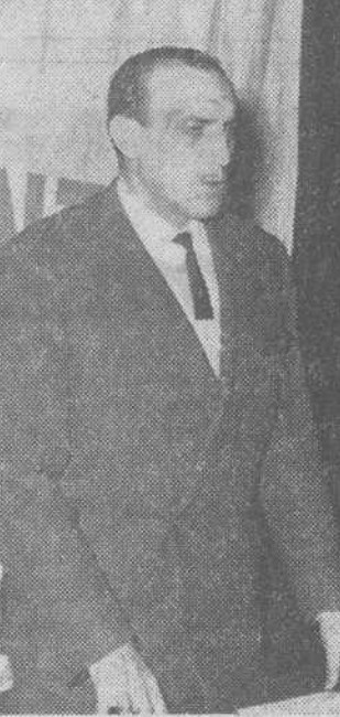
EL GOBERNADOR CIVIL CLAUSTRÓ EL ACTO