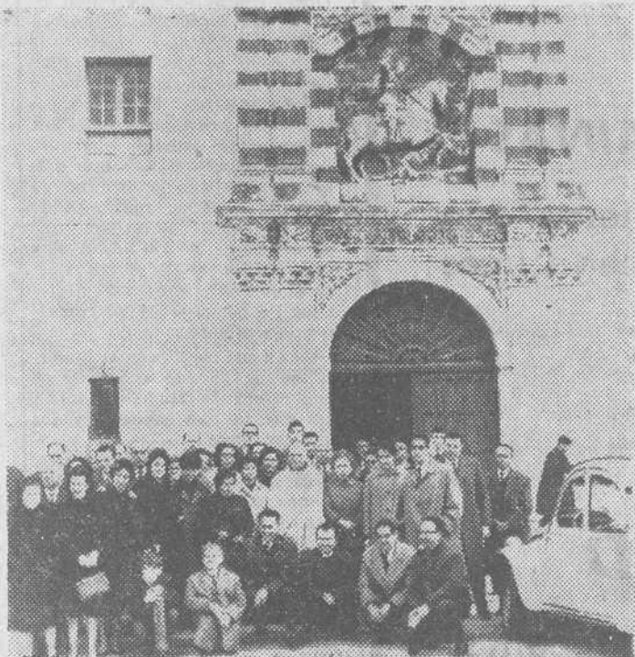
Grupo de impositores de la Caja de Ahorros del Círculo en su visita a la Cartuja de Miraflores y Monasterio de San Pedro Cardena el pasado domingo día 6

—¿A qué se debe entonces? —Ha llegado el momento. La Sección de Cultura de la Caja de Ahorros del Círculo, celosa y deseosa de que los monumentos de la ciudad sean conocidos de todo, ha organizado una serie de visitas domingueras y completamente gratis bajo su patrocinio y bajo el título «Conozca Vd. su Ciudad». Hasta la fecha se han llevado a cabo visitas a la Catedral, Museo de las Huelgas, Arco de Santa María y parroquia de San Esteban, Museo provincial ins-