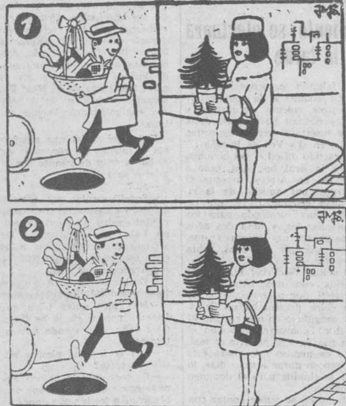
Estos dos dibujos son aparentemente iguales. Siete diferencias los separan. Si es usted buen observador debe descubrirlos antes de cinco minutos (La solución mañana)