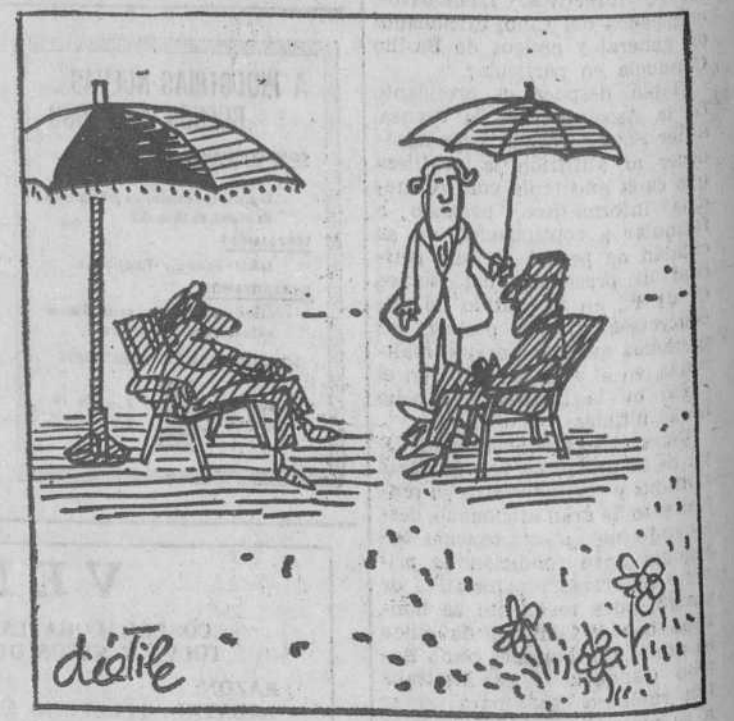
—¡Vaya, vaya; usted es de los que todavía pueden costear mano de obra!

A los siete errores: Ramo, cejas futbolista, hierba, pelo señorita, cuello futbolista, flor y cinturón señorita.