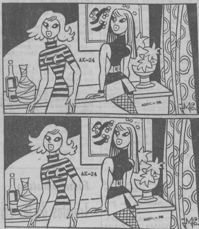
Estos dos dibujos son aparentemente iguales. Siete diferencias les separan. Si es usted buen observador debe descubrirlos antes de cinco minutos.