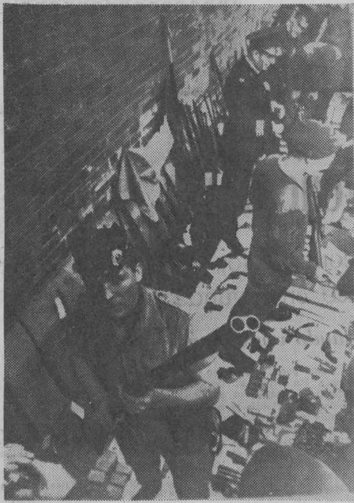
Belfast. — Soldados británicos y Policía del Ulster muestran las armas capturadas en la zona de Falls Road después de una noche de violencias.