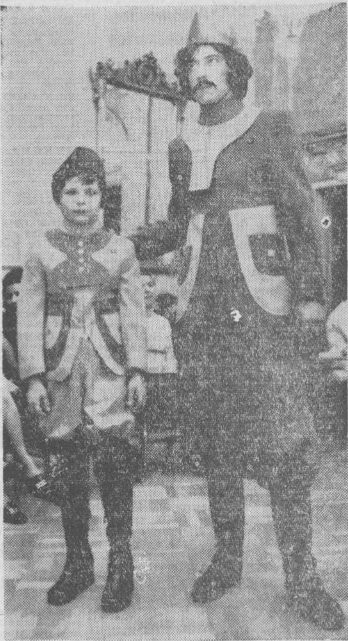
Viena. — Un famoso diseñador de moda masculina vestirá al «caballero-70» como a los turcos. Llama a su creación «Bóstor»