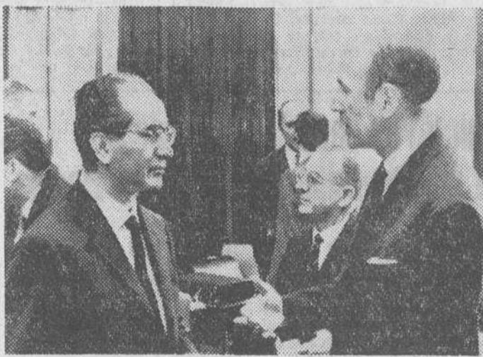
Bruselas (Bélgica). — El ministro del Tesoro italiano, Emilio Colombo (izquierda) conversando con el ministro de Finanzas francés, Valéry Giscard D'Estaing, durante la reunión del Consejo de ministros del Mercado Comun.