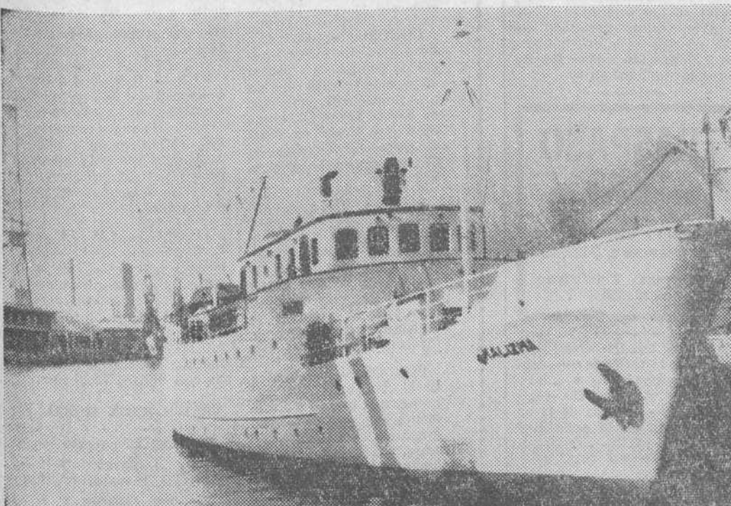
Barcelona. — Llegó al puerto de esta ciudad y procedente de Alicante, el yate de Richard Burton y Liz Taylor. En la foto, una vista del yate anclado en el muelle de Barcelona