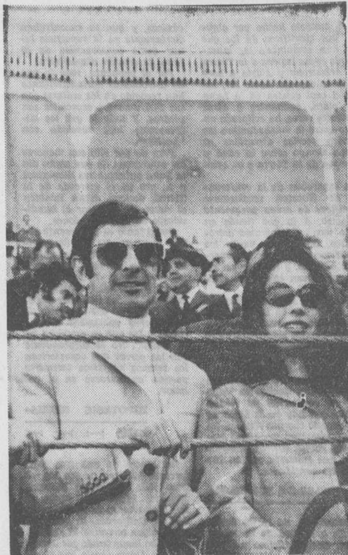
El boxeador Pedro Carrasco, en compañía de una bella señorita, presenciando una corrida de toros en la plaza Monumental de Madrid.

Pedro Carrasco, nuestro campeón de Europa, de los pesos ligeros, sigue aspirando al título mundial en su clase. ¿Cuándo llegará ese momento? Es cosa que aún no se sabe con exactitud, empero es posible que tal acontecimiento boxístico tenga lugar en este mismo año. Las autoridades en esta materia dirán, cuando proceda, lo que haya sobre el particular.