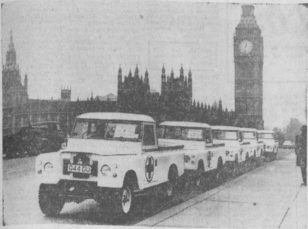
Un convoy de coches Land Rovers (15 en total), de la Cruz Roja de Nigeria, es fotografiado cuando pasa sobre el puente de Westminster, en Londres, en su camino hacia Manston, Kent, desde donde serán enviados por avión a Nigeria, para ser utilizados en las tareas de ayuda al pueblo biafraño.