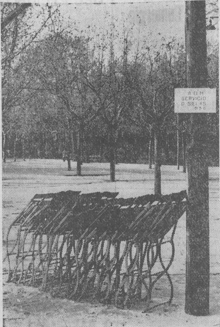
Triste destino el de las sillas de los parques durante el invierno. Ellas, que durante la primavera y el verano, fueron testigo de tantas conversaciones y momentos felices, esperan ahora, en vano, el cliente que por la módica cantidad de cincuenta céntimos las alquile. Pero aún tendrán que esperar a que tengan hojas y florezcan los rosales para que la pareja de enamorados, o la de ancianos, o la mamá con el bebé, acudan al parque para sentarse sobre ellas. La foto está obtenida en el parque madrileño del Retiro.