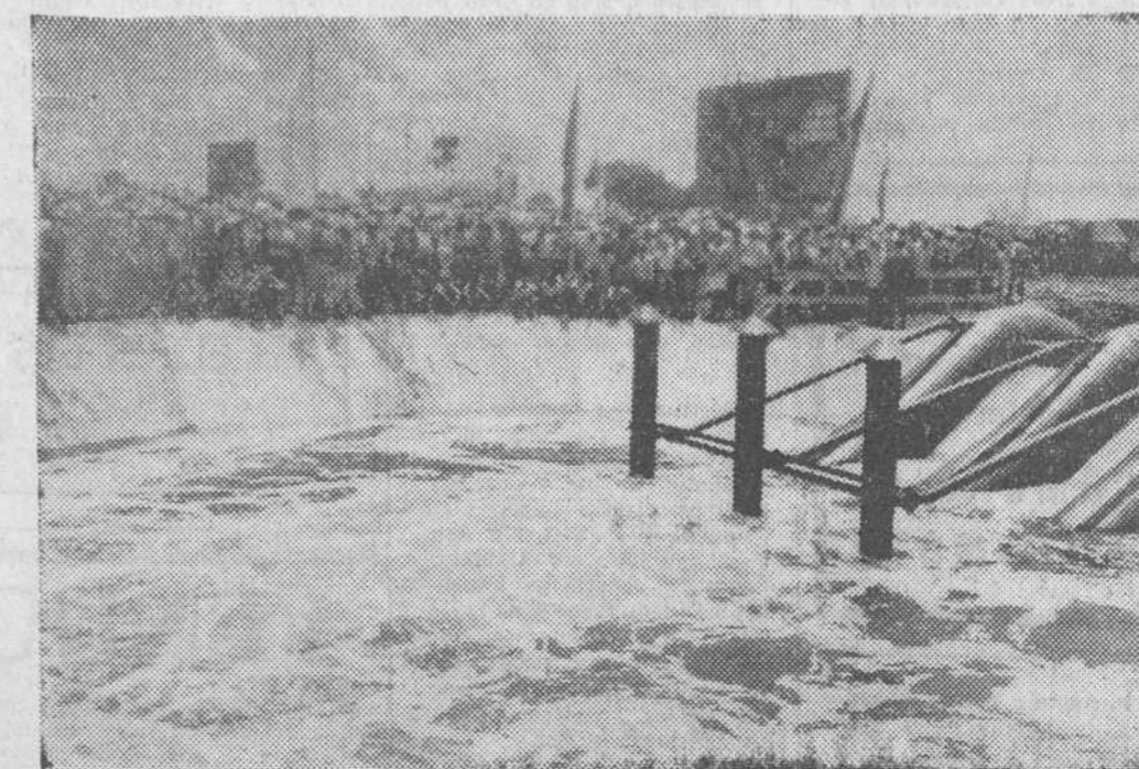
Las aguas del río Cauto, uno de los mayores de Cuba, que dan vida a esta vasta zona de la provincia de Oriente, aunque también tiene una larga historia de muertes y destrucción, ha sido por fin dominado. Durante seis años se han realizado en él importantes obras para controlar las aguas y dirigirlas para un mejor aprovechamiento. Se han construido diversas presas como la de «Gilbert-Valdés Roig», con capacidad para 42 millones de metros cúbicos y de cuya inauguración vemos un momento en esta fotografía.