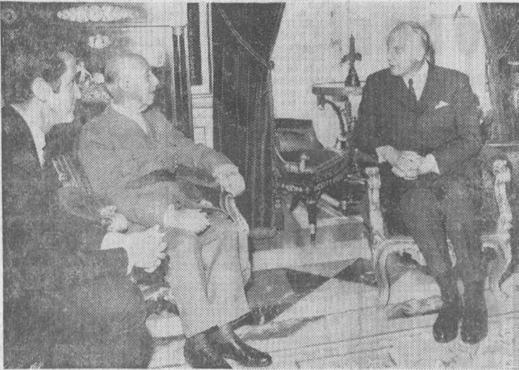
Madrid. — El jefe del Estado, Generalísimo Franco ha recibido en audiencia en el Palacio de El Pardo, al ministro alemán de Asuntos Exteriores, señor Walter Scheel, a quien acompañaba el ministro español, señor López Bravo y los embajadores de España en Bonn y de la República Federal de Alemania en Madrid.