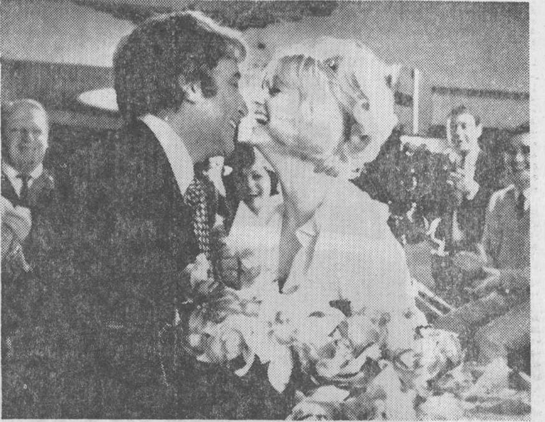
Shepperton (Inglaterra). — La actriz Goldie Haws es felicitada por el actor Peter Sellers por el «Oscar» a la mejor actriz secundaria, que le ha sido concedido por su interpretación en la película «Cactus Flowers». Goldie y Peter figuran en el reparto de la película «There's a Girl in My Soup», que se rueda en esta ciudad.