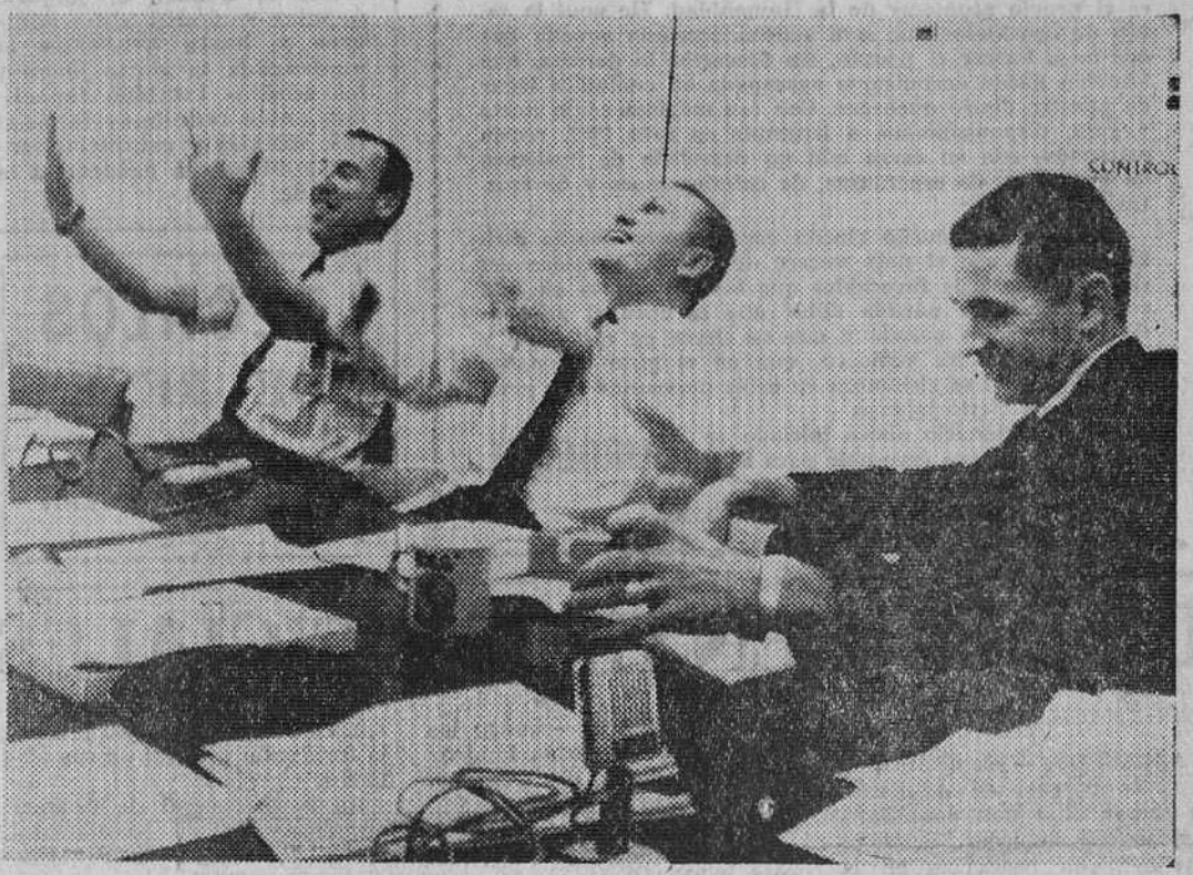
Centro Espacial de Houston. — Los astronautas Lovell, Borman y Anders, de izquierda a derecha, rien de buena gana durante su permanencia en el Centro Espacial de Houston, donde relataron su histórico viaje a la Luna.