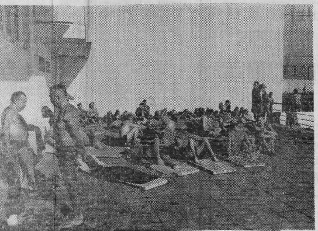
Los últimos días Barcelona ha gozado de una temperatura auténticamente primaveral. Por ello las playas cercanas a la Ciudad Condal se han visto concurridas por atrevidos bañistas como estos de la foto.