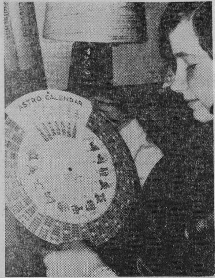
El danés Piet Hein acaba de crear un calendario astrológico para 301 años o 109.938 días.