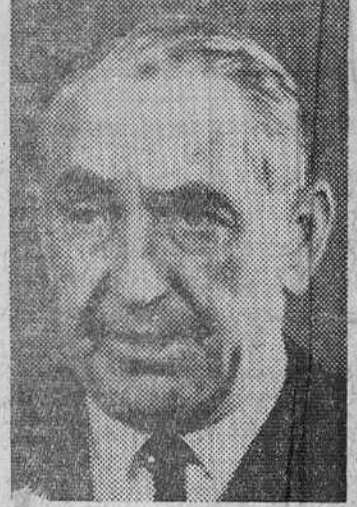
Washington. — David Packard, fue nombrado vice-secretario de Defensa en una conferencia de Prensa, Packard, de 56 años de edad, ocupará su puesto durante la administración de Nixon. Packard es el presidente de la Compañía Hewlett-Packard.

En la homilía, Su Santidad el Papa dio lectura a un discurso, en el que puso de relieve el significado de esta jornada — instituida por Pablo VI en el mensaje del 8 de Diciembre de 1967. Posteriormente, varios jóvenes dieron lectura a las intenciones de la oración de los fieles, dedicadas especialmente a la concordia de todos los hombres, por el mundo de la justicia, por los que sufren hambre y por la repartición justa de los bienes necesarios, por los que no tienen una casa ni una vida digna, porque los desocupados encuentran un noble trabajo y por el deseo de paz que la Navidad simboliza a través del nacimiento del Príncipe de la Paz.