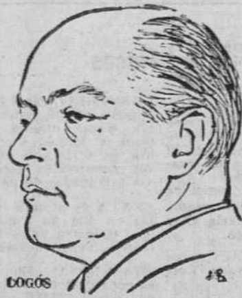
Logos. —¿Quería V. E. ante el año 1969, enviar algún mensaje especial al pueblo español?

Creo que mi respuesta es clara. El Fuero del Trabajo, que es una ley fundamental, será puntualmente respetado. Pero unas Asociaciones a las que se declara libres y representativas, pueden colaborar entre sí para cuanto juzgen necesario. Cercenaríamos esa libertad, si tratásemos de estorbar que dos Asociaciones —las de técnicos y trabajadores— formen una Sección Social, a efectos internos del Sindicalismo, si sus miembros así lo quieren. Libres son para unirse en lo conveniente y necesario.