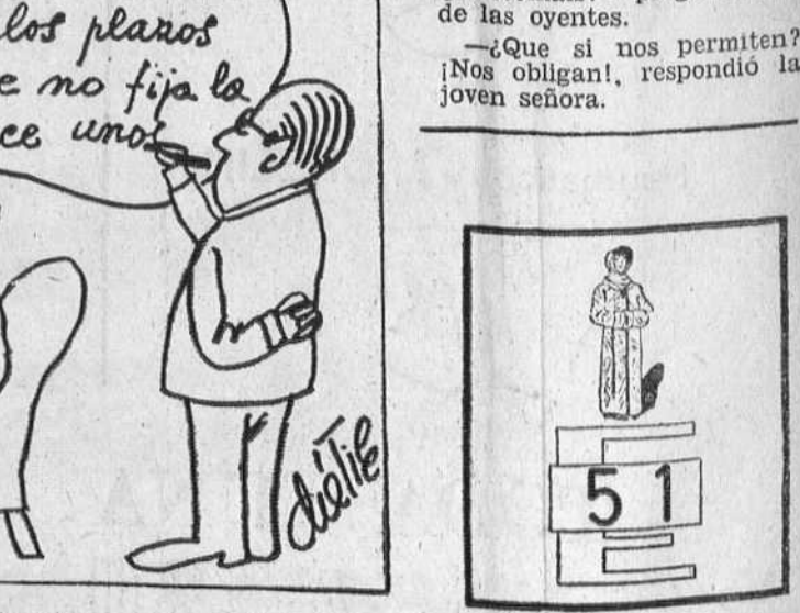
—Es usted un buen colaborador. ¡Va aprendiendo a dar forma a mis ideas...!