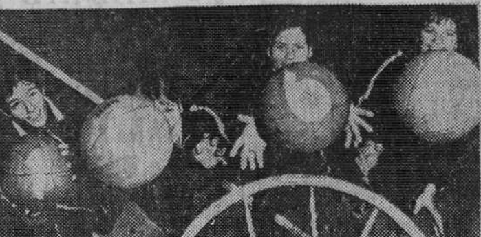
Finalizó 1968. Bienvenido sea 1969. Felicidad y prosperidad es lo que nos desean estas cuatro jugadoras del equipo de baloncesto del Club Gimnástico y Deportivo de Berlín, que lanzan a la canasta sendos balones con los números del nuevo año.