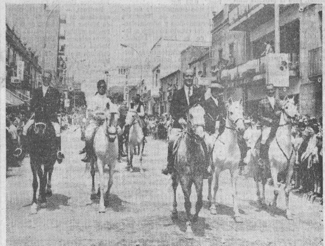
Dentro de las fiestas y ferias de la localidad barcelonesa de Granollers, que se celebran actualmente, ha tenido lugar el tradicional desfile de los caballistas. Al frente de uno de los grupos marchó a lomos de un bonito corcel el presidente de la Diputación provincial de Barcelona, don José María de Muller y Abadal, a quien vemos en esta fotografía en primer término