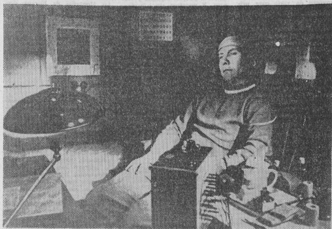
Los astronautas —en la foto, el soviético Pavel Popovitch— como entrenamiento anterior a los vuelos son encerrados en cámaras herméticas. La ciencia médica trata de determinar los efectos producidos por el aislamiento en el organismo humano.