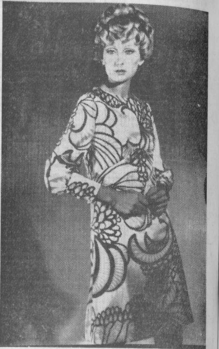
Vestido en surah Arnel. Original estampado en negro sobre fondo blanco. Largos puños y corselete en punta. Modelo de Linge's

Vemos con alivio que la Moda sigue actuando a favor de la femineidad, de lo juvenil, en fin, a favor de la mujer. Todas sus tendencias buscan dar el máximo de atractivo, resaltar todo lo que de delicado y bello posee. Y así vemos, sin olvidar el más elemental sentido de la elegancia, combinar en vuelos de fantasía, colores y dibujos, escotes profundos, transparencias... el cuerpo femenino tiene para los diseñadores la mayor importancia.