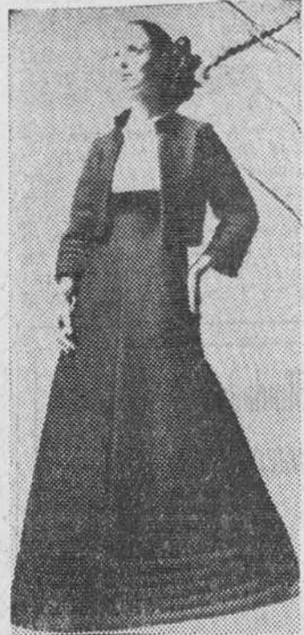
Pierre Balmain firma este traje de noche, marrón oscuro, en gabardina de raso y cuerpo blanco.