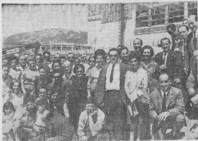
Al regreso, los excursionistas visitaron Frias, pasando un buen día campestre y conociendo palmo a palmo los parajes burgaleses...