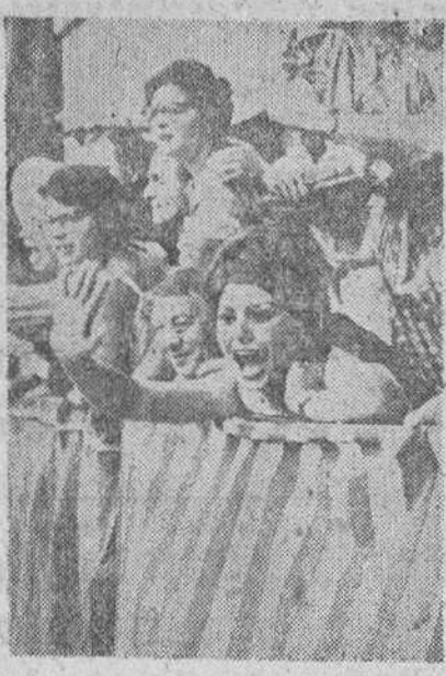
Siena. — Con asistencia de unas cincuenta mil personas, se ha celebrado en Siena la tradicional Fiesta del Palio, original carrera a caballo que fue ganada por el equipo de Istrie. En la foto, Sofía Loren presenciando la competición desde un balcón de la plaza.