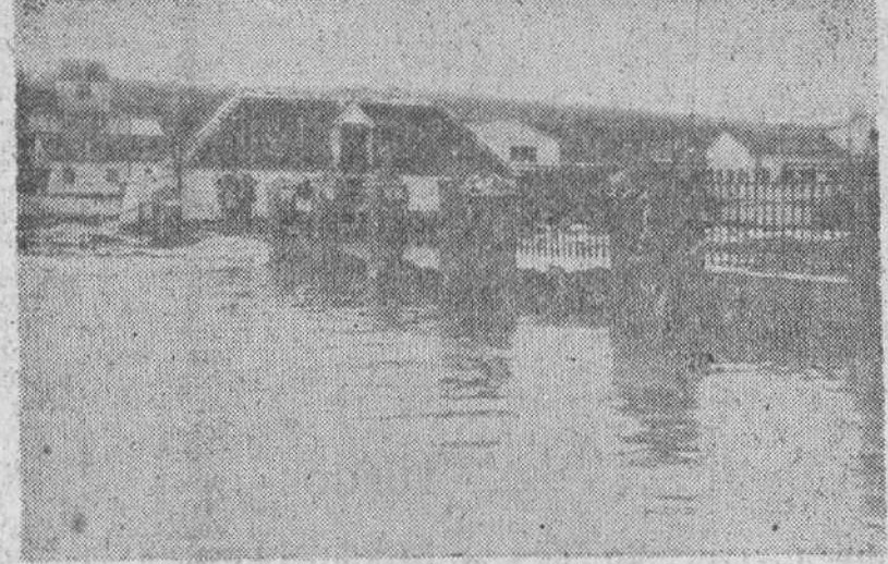
Diez muertos y varios desaparecidos después de la tormenta de Lucena. Aspecto que ofrece el exterior de la fábrica de aceites «Las Fontanillas», una de las industrias más afectadas por la tormenta.

Cuando iba a prestar servicio se le dispara la pistola y muere en el acto