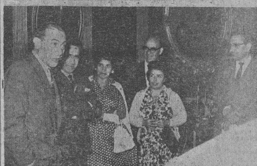
A mediodía de ayer, el Ayuntamiento ofreció una recepción a los profesores norteamericanos que asisten al «Seminario» recientemente inaugurado en nuestra ciudad y que viene desarrollándose en el Instituto de Enseñanza Media. — En el precedente grabado, grupo de concurrentes a dicho acto y momento en que el alcalde de la ciudad dirige un cordial saludo a los ilustres visitantes de la Casa Consistorial.