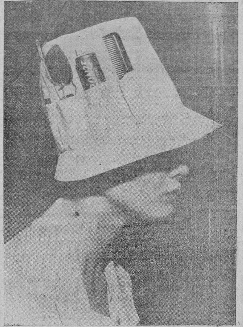
LONDRES. — Dentro de la colección de nuevos modelos de sombreros para campo y playa, en la próxima temporada vestirá un sombrero inglés ha presentado este gorrijo que evita los engorros de las bolsas de mano. El peine, el bofrato, las gafas y hasta la crema contra las quemaduras del sol podrán llevarse en adelante en la cabeza.