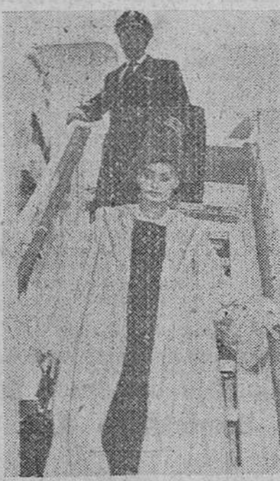
Sofía Loren, la Doña Jimena de "El Cid", a su regreso a España para proseguir el rodaje de aquella película, tras sus breves vacaciones navideñas, transcurridas en Milán. En la foto, aparece descendiendo del avión a su llegada a Barajas.

bre no es otro que el de dar ese sentimiento de seguridad a la mujer. Un hombre demasiado joven no sabría dar confianza a una mujer inquieta.