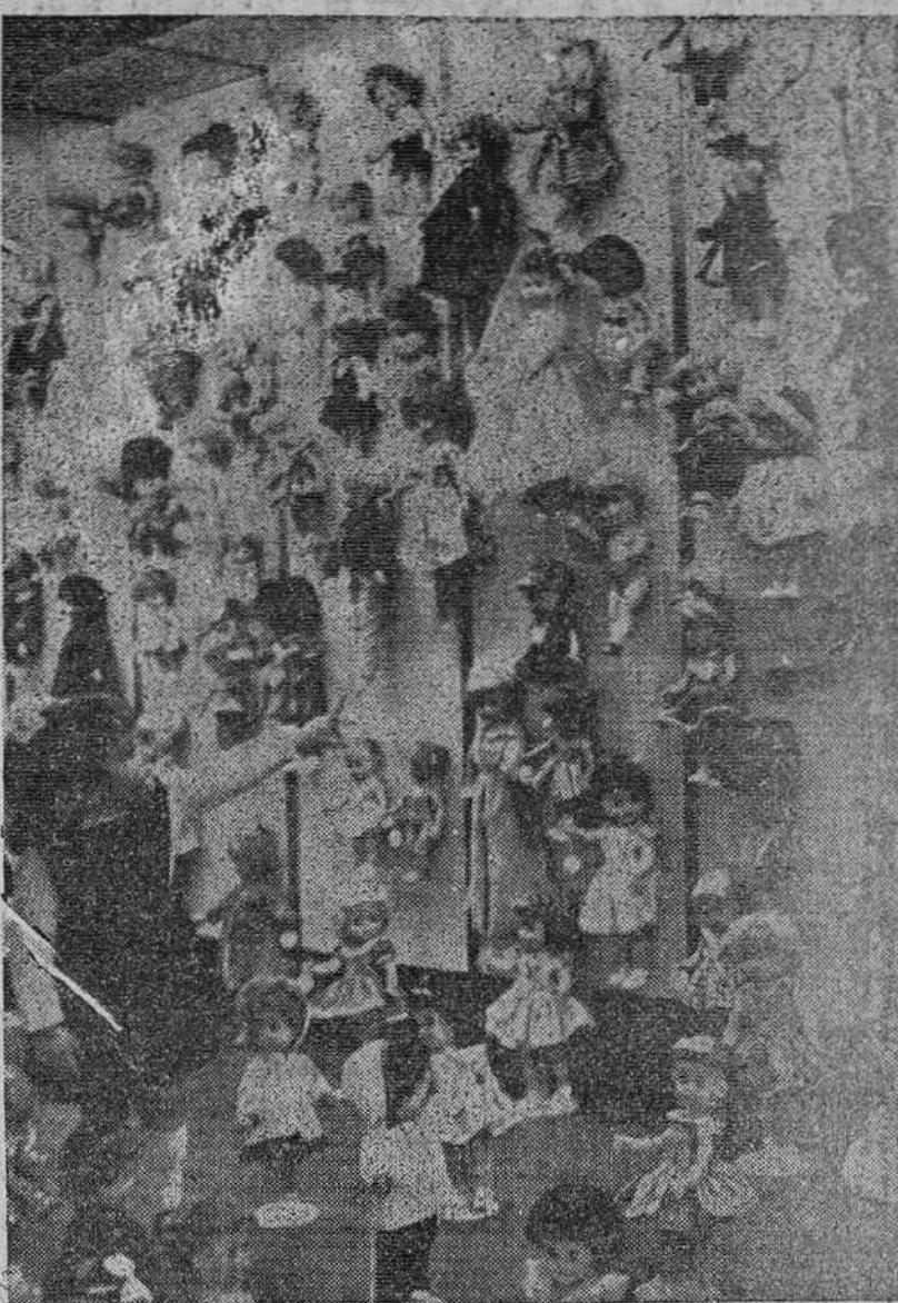
Como una muñeca más entre cientos de ellas, esta niña se decide, al fin, por la que más le gusta y que sin duda los Reyes Magos dejarán junto a sus zapatitos en la madrugada de mañana. La ilusión de todos los niños se verá cumplida dentro de pocas horas.