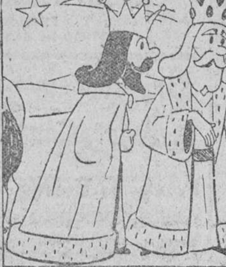
—Buena, pero nosotros ¿qué tenemos que ver con lo del Congo?

servicios especiales de DIARIO DE BURGOS