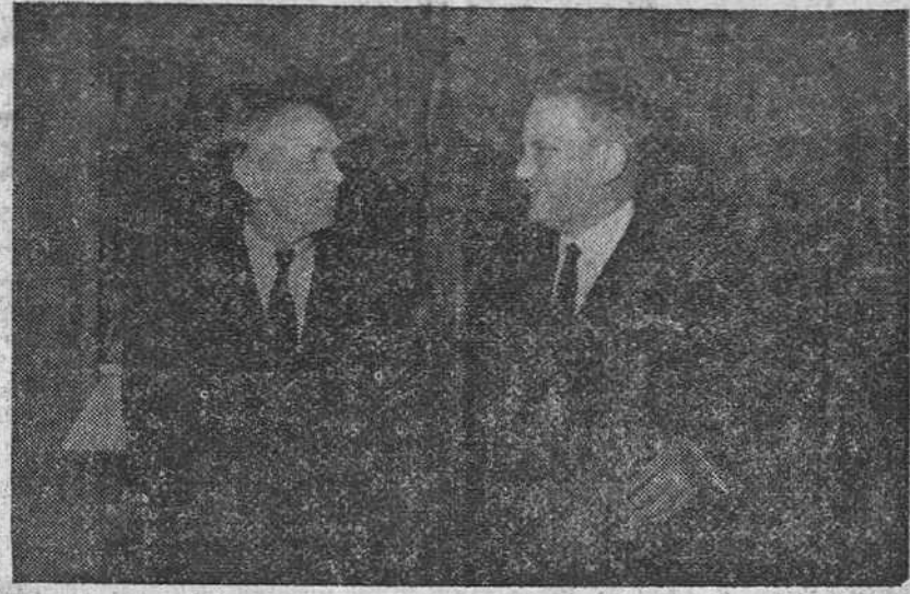
Madrid.—El secretario del Foreign Office, Lord Home y el ministro de Asuntos Exteriores español, señor Castiella, durante su entrevista en el Palacio de Santa Cruz. —Ministerio de Asuntos Exteriores de España.— (Foto «Cifra»)

Terminada la entrevista, el ministro de Negocios Extranjeros de Gran Bretaña abandonó Palacio con el mismo ceremonial que a su llegada. —Cifra.