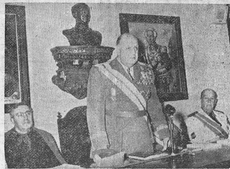
El ministro del Ejército, teniente general Barroso, durante su discurso, en la Academia de Ingenieros.

Discurso del ministro del Ejército en la Academia de Ingenieros