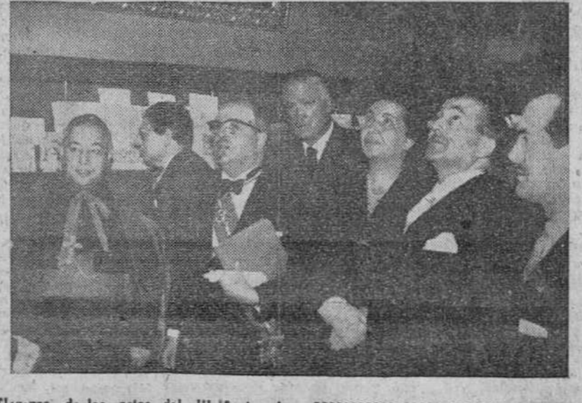
Clausura de los actos del III Centenario del nacimiento de Velázquez. Con asistencia del ministro de Educación Nacional, directores generales de Enseñanza Universitaria y Bellas Artes y autoridades civiles y militares de Sevilla, se han clausurado los actos del tercer centenario del nacimiento de Velázquez.

El señor Solís anunció en este momento la llegada del ministro de Agricultura, a quien acompañaban el subsecretario del Departamento y todos los directores de los departamentos y sus acompañantes se situaron en la presidencia y el señor Solís pronunció unas palabras agradeciendo la presencia del señor Cánovas quien pronunció seguidamente un discurso.