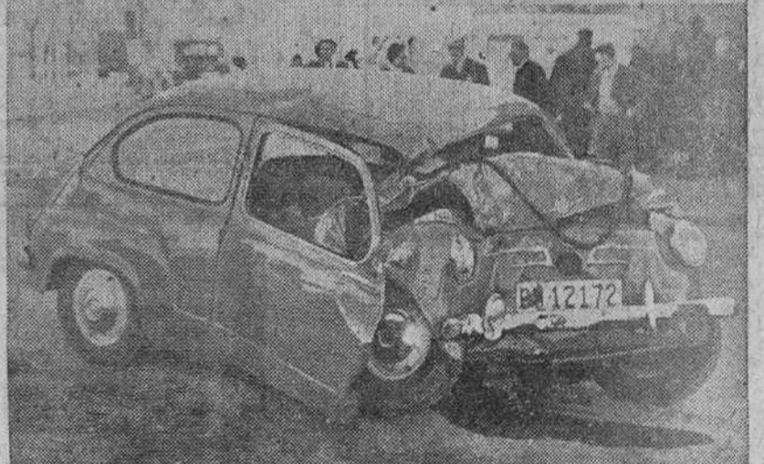
Estas dos fotografías, obtenidas por «Efe» en el lugar del suceso, dan idea de la violencia del choque sufrido por el «Seat 600», en la curva del pueblo de Vivar del Cid.