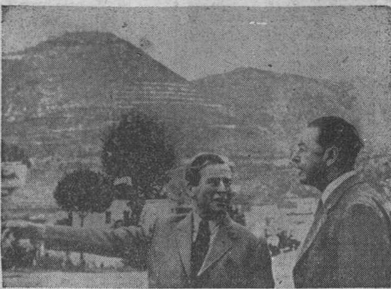
Lord Alexander y Lord Harding, que fue su jefe de Estado Mayor durante la guerra, comentando la línea que tuvo lugar en Cassino y sus alrededores, en la visita que hicieron a esta localidad en 1960. En el fondo el famoso monasterio de Monte Cassino que en la actualidad está completamente reconstruido.

HANOMAG BARREIROS Dilasa AGENCIA EN BURGOS: VITORIA, 31 TELEFS. 3965, 4903 y 4668