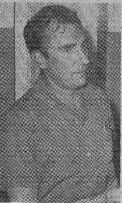
Serio, correcto y veraniego. Fernando Fernán Gómez parece pensar con nostalgia en la playa.