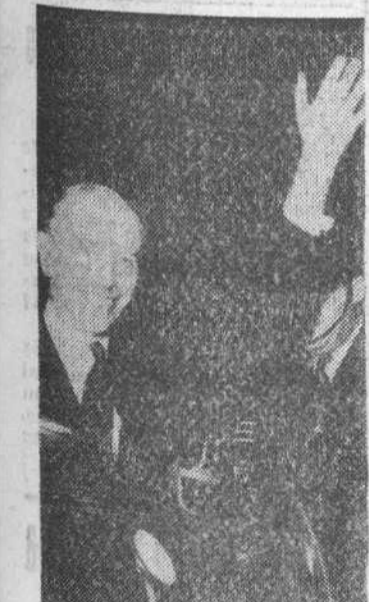
Londres. — Lord Home, nombrado por la Reina Isabel II nuevo primer ministro de Gran Bretaña por dimisión de Mac Millan, en el momento de dirigirse al Palacio de Buckingham donde fue recibido por la Reina

Dieciséis mil soldados norteamericanos con sus pertrechos y equipo pesado serán transportados a Europa en menos de 72 horas