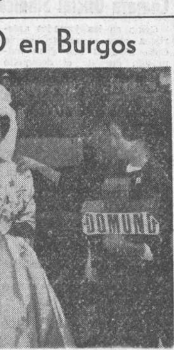
Con gran fervor se conmemoró el domingo, en nuestra ciudad el DOMUND.—En nuestro grabado, simpática estampa de la colecta por las calles. Cuando una gentil novia llegó a la iglesia de San Lesmes, le salió al paso la postulante que aparece en nuestra placa cuando se dispone a prender en aquella el emblema misional.

Es posible que Paulo VI convoque un nuevo Consistorio para la creación de Cardenales