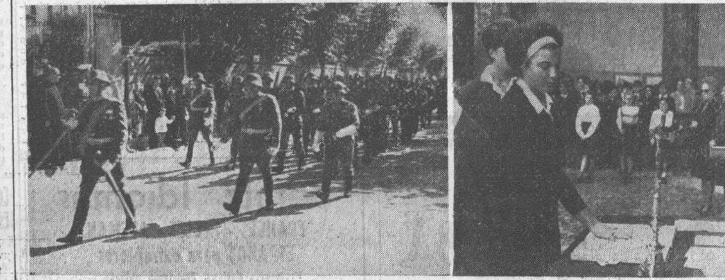
Según costumbre, ayer, festividad de Santa Teresa, celebraron su fiesta patronal el Cuerpo de Intendencia y la Sección Femenina. En nuestras plazas: desfile de las tropas de Intendencia, después de la misa celebrada en el convento de Padres Carmelitas. A la derecha, una muchacha prestando su juramento como militante de Sección Femenina.