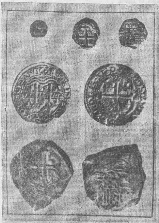
Piezas de a ocho, doblones de plata y de oro de Méjico, Perú, España, se han tragado a toneladas los mares de los dos hemisferios, desde el naufragio el 20 de Junio de 1502, cerca de Cabo Engaño, de los 24 galeones de Cristóbal Colón.

"Estoy seguro", comentaba don Fernando Colón hijo del Almirante, "de que aquello fue