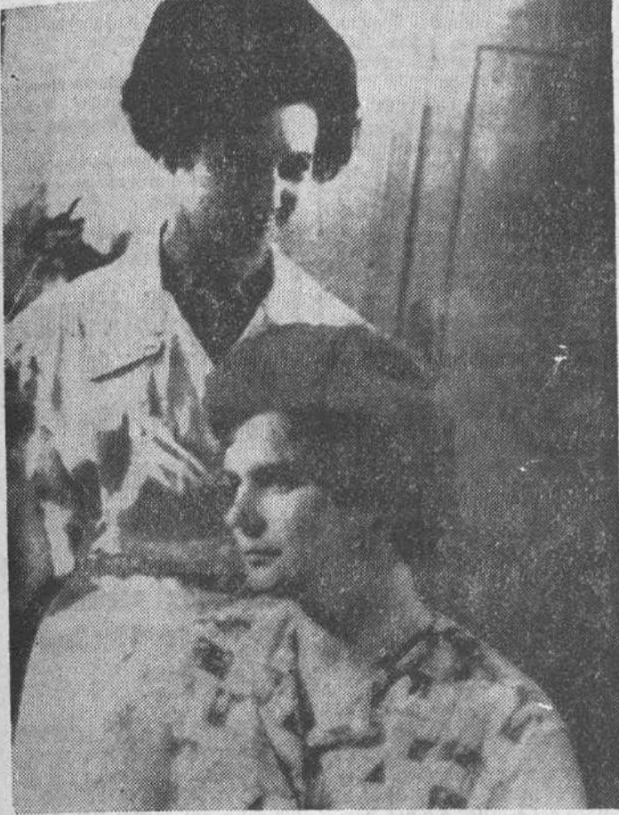
Los rusos cuidan mucho a sus cosmonautas. Y si se trata del sexo femenino, cuidan también su coquetería. Aquí vemos a Valentina que, la tarde antes de ser lanzada al espacio, fue a la peluquería para que le «arreglaran la cabeza». Su gesto pensativo nadie sabe si está puesto en la complejidad de su aventura astral o en Gagarin, su novio astronauta y futuro esposo, según se dice.

A astronauta rusa Valentina Terechkova no podía imaginar que al dormirse en su cabina espacial en el momento preciso en que su programa de trabajo preveía que debía enviar sus observaciones científicas hacia la Tierra, iba a enriquecer los recursos médicos contra el insomnio. La involuntaria indisciplina de Valentina indujo a los especialistas a realizar una encuesta con otros astronautas, cayendo entonces en la cuenta de que el estado de ingravidez obliga casi irresistiblemente a dormir. En cuanto el astronauta ha permanecido inactivo más allá de un cuarto de hora, experimenta la necesidad imperiosa de dormir. Este hecho ha servido de inspiración a los médicos norteamericanos para su terapéutica del insomnio, consistente en acostar a los pacientes en un lecho-bañera que flota en agua salada y cuya temperatura se mantiene a 37 grados centígrados.