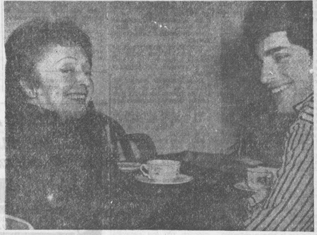
EDITH PIAF, JUNTO A SU JOVEN ESPOSO, THEO SARAPO, EN UN MOMENTO DE FELICIDAD.

SUS COMIENZOS La madre de Edith Piaf era una oscura cantante italiana. El padre un acróbata francés. Edith comenzó a cantar, desde muy niña, en un circo, por un puñado de francos. No le fue fácil el triunfo. Tarde más de quince años en llegar, a través de una vida azarosa, ligera e incómoda. Hasta que un día fue descubierta por el director de una famosa sala de fiestas. Allí comenzó su vertiginosa carrera hacia la gloria. Primero, París. Luego, Fran-