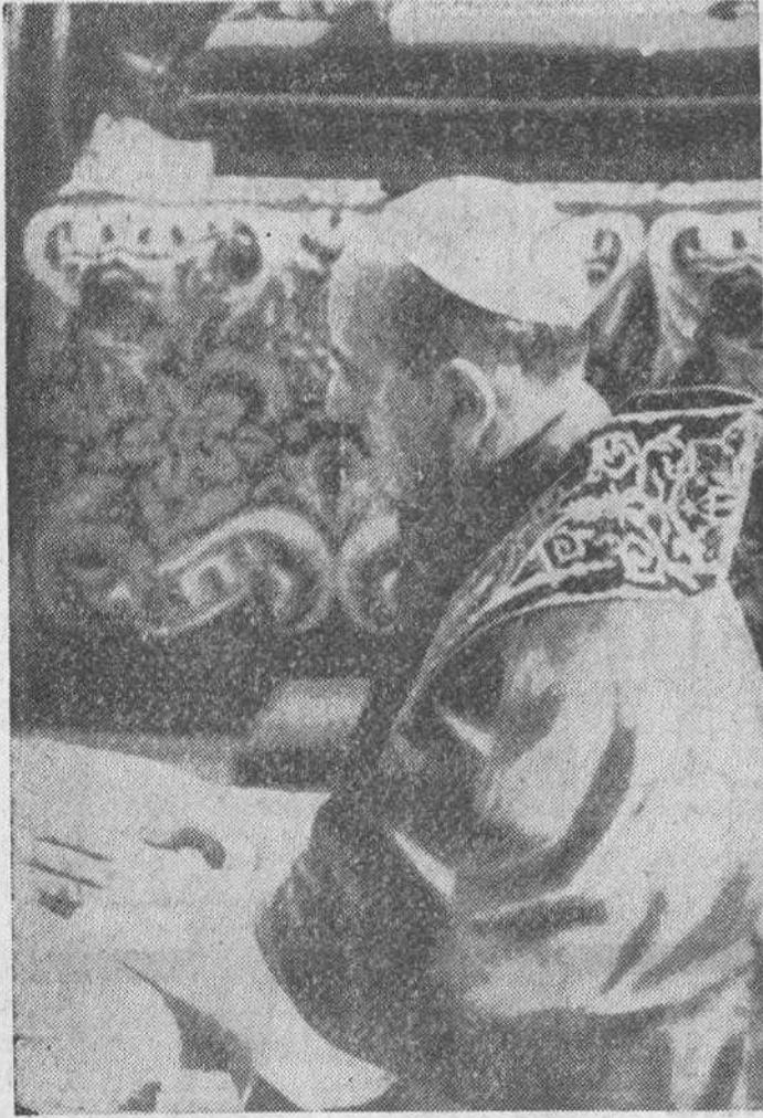
Su Santidad Paulo VI durante las ceremonias celebradas en la Basílica de San Pedro, para la beatificación de Mons. Juan Newmann, que fue obispo de Filadelfia (Estados Unidos).

En España hay 375.000 sirvientas Los niños de la «Operación Plus Ultra» tienen resuelto su porvenir Con su comedia «Veraneando» parece que no ha acertado Paso