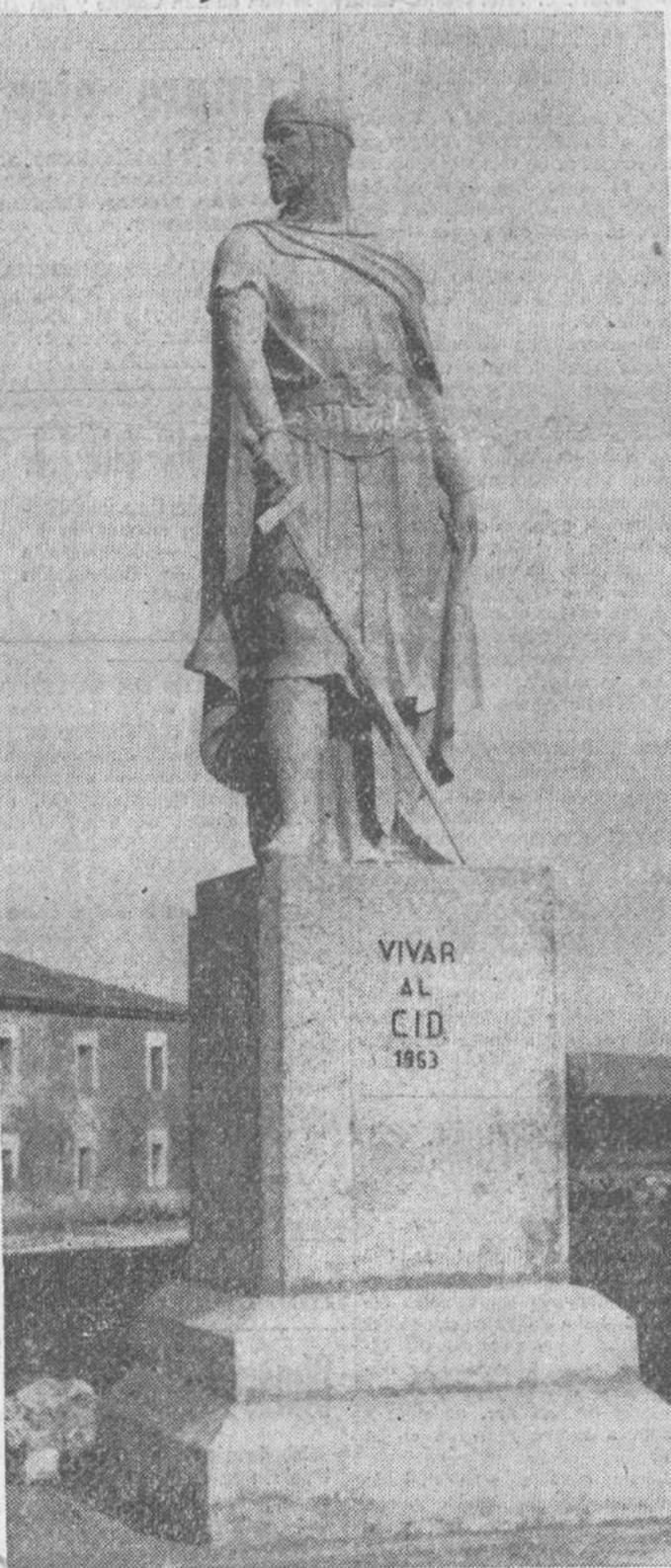
Mañana, a mediodía, será solemnemente bendecida e inaugurada la estatua erigida en Vivar del Cid en homenaje al Campesino. He aquí el monumento, obra del doctor Catalá, que lo ha regalado al histórico pueblo.