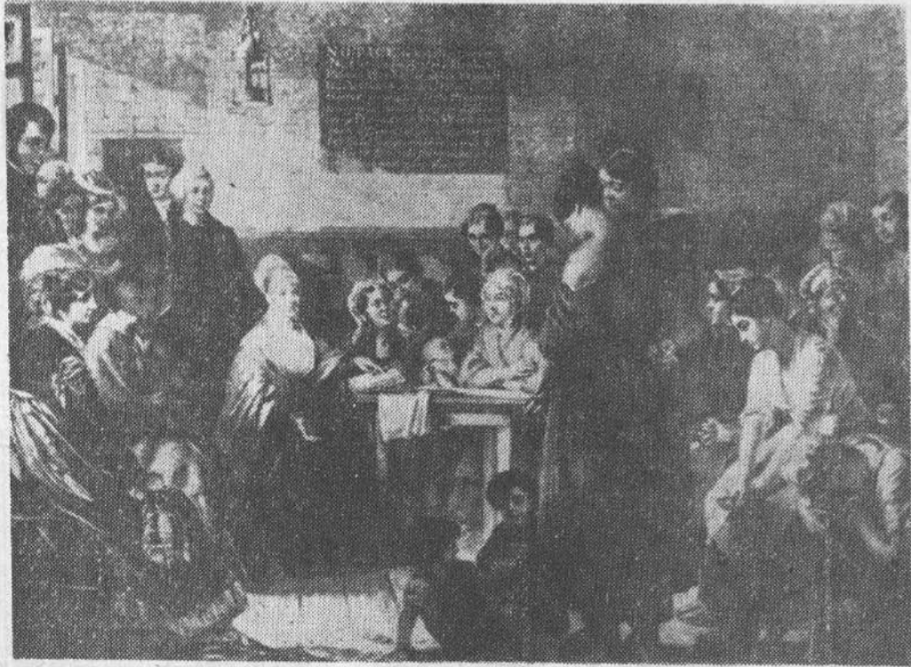
Elizabeth Fry leyendo la Biblia a los presos de la cárcel Newgate. Fue una de las primeras en ayudar, en Inglaterra y en otros muchos países, a la reforma del sistema penitenciario.

Ante este cuadro de contemplación dirigió a los presos las siguientes palabras: "Vosotros sois hijos de Dios y, sea cual sea el delito que hayáis cometido, el no os abandonará jamás". Al escuchar estas palabras, pronunciadas con suave y melódica voz, los presos se arrodillaron y rezaron con ella, ante el asombro de las autoridades presentes. Elizabeth salió de allí con el firme propósito de mejorar sus condiciones. El primer paso consistió en abrir, con el permiso de las madres, una escuela para los niños, donde éstos pudieran aprender a leer, escribir, y conocer las Sagradas Escrituras. El segundo paso fue dividir a las reclusas en grupos de doce, bajo una instructora elegida entre ellas mismas, la cual pudiera realizar trabajos de utilidad, tales como coser y hacer punto.