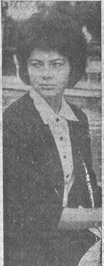
La ex-emperatriz Soraya de Irán, la esposa de los ojos tristes, sorprendida en Roma donde se ha entrevistado con el productor cinematográfico Dino de Laurenti para elegir el tema de la película que va a interpretar. El productor ha ofrecido a Soraya cuatro temas distintos y la emperatriz se ha decidido, al parecer, por el de Catalina la Grande de Rusia.