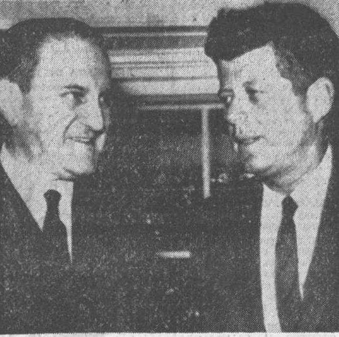
Washington.— El presidente Kennedy y el ministro español de Asuntos Exteriores Castiella, durante su entrevista en la Casa Blanca.