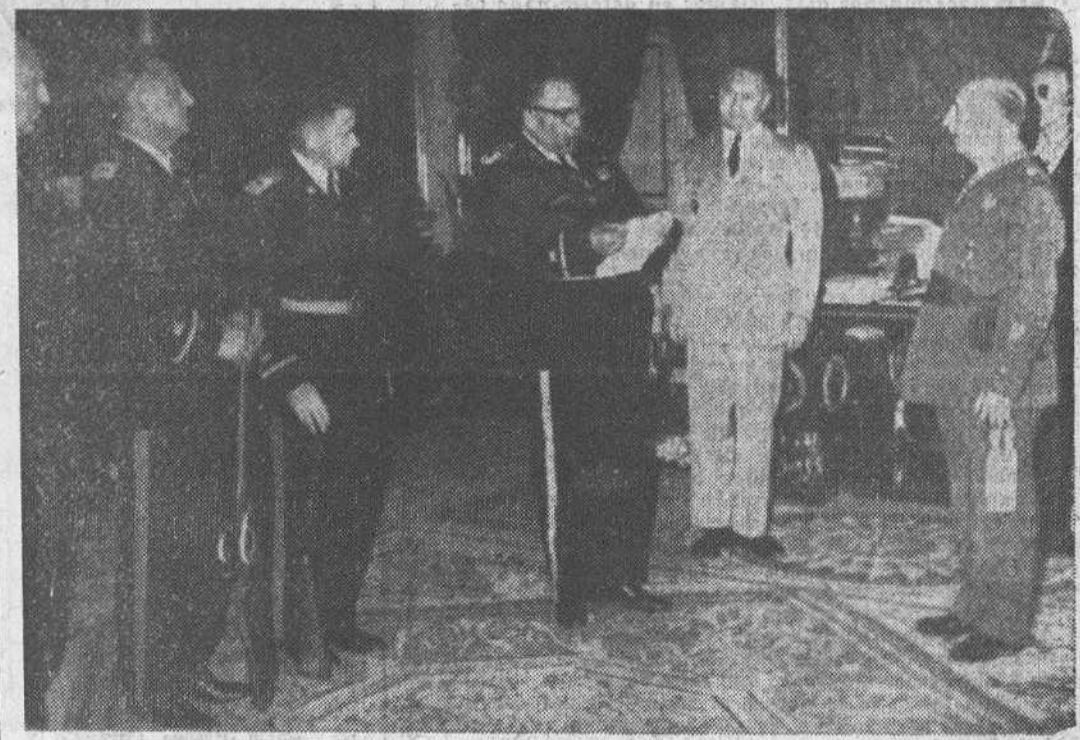
Con motivo del próximo congreso internacional de excombatientes que se celebrará el domingo, día 13 en el Valle de los Caídos, 200 excombatientes de la «Antigua y Honorable Compañía de Artillería de Massachusetts, una orden militar norteamericana, ha visitado al jefe del Estado español en el palacio de El Pardo. En la foto, Franco escuchando las palabras de salutación del representante de la orden.