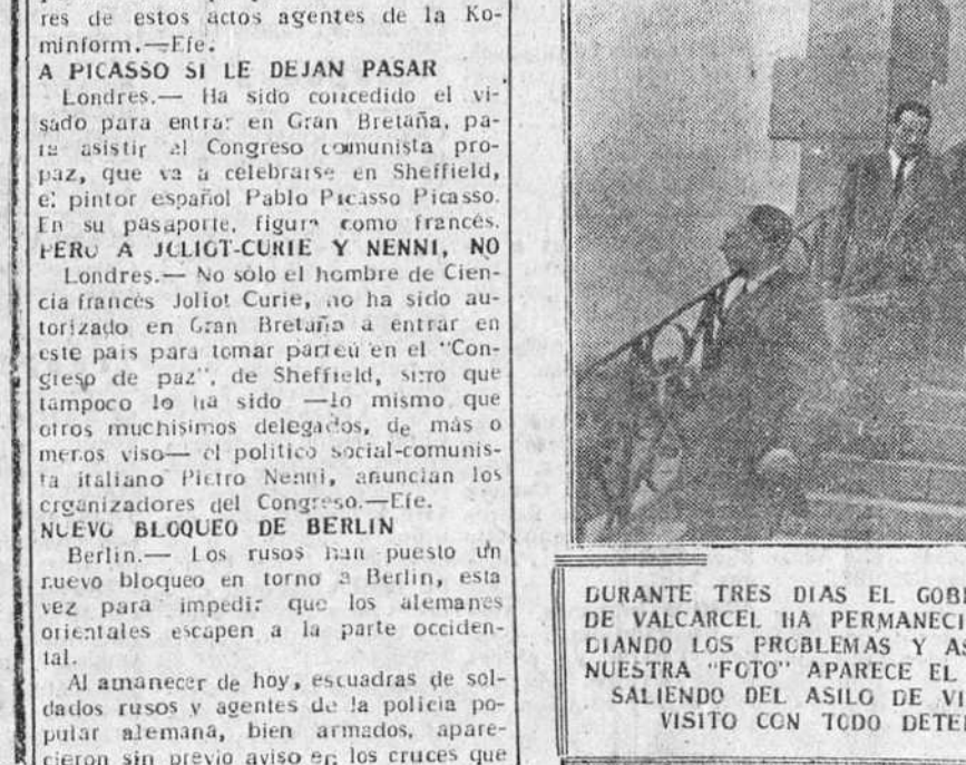
DURANTE TRES DIAS EL GOBERNADOR CIVIL SEÑOR RODRIGUEZ DE VALCARCEL HA PERMANECIDO EN EL VALLE DE MENA ESTUDIANDO LOS PROBLEMAS Y ASPIRACIONES DE LA COMARCA. EN NUESTRA FOTO APARECE EL SEÑOR RODRIGUEZ DE VALCARCEL, SALIENDO DEL ASILO DE VILLASANA, CUYAS INSTALACIONES VISITO CON TODO DETENIMIENTO.