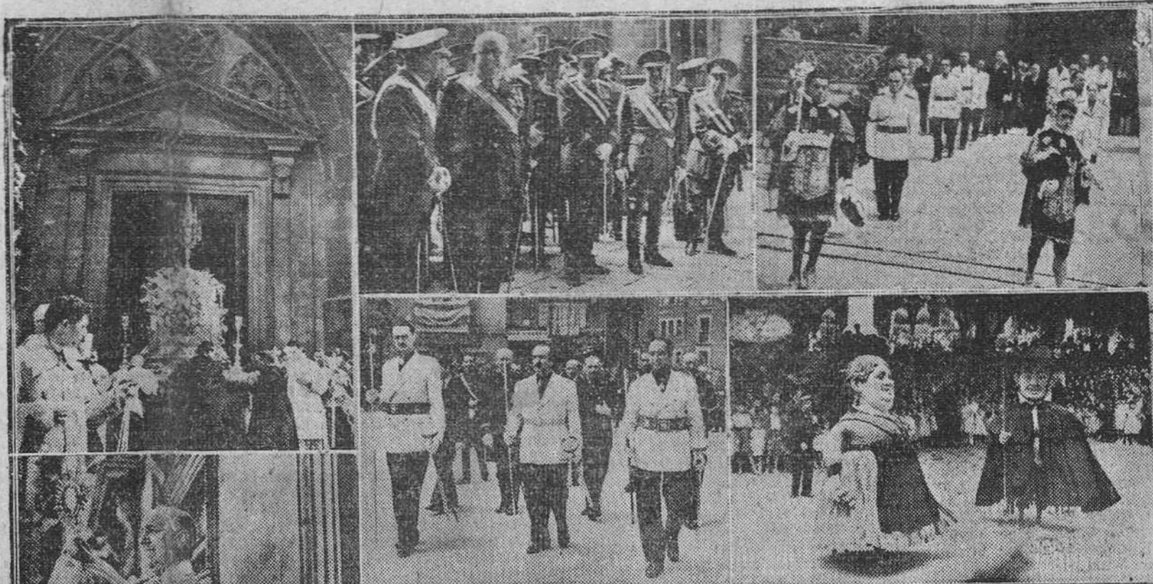
Reportaje gráfico de FEDE de los solemnes actos celebrados el jueves en nuestra ciudad con motivo de la festividad del Corpus. De izquierda a derecha; arriba: la carroza de plata, portadora del Santísimo, al salir de la Santa Iglesia Catedral, al iniciarse la procesión; el teniente general Yagüe y las demás autoridades militares que formaron en el cortejo, y la Diputación provincial en Pleno al salir del S. T. M. Abajo: el Excmo. y Rvdmo. Sr. Arzobispo dando la bendición con el Santísimo al pueblo desde el balcón de la Casa Consistorial; el gobernador civil, presidiendo al Ayuntamiento en la procesión y los "gigantillos" ejecutando sus graciosas danzas, a mediodía, en la Plaza de José Antonio.