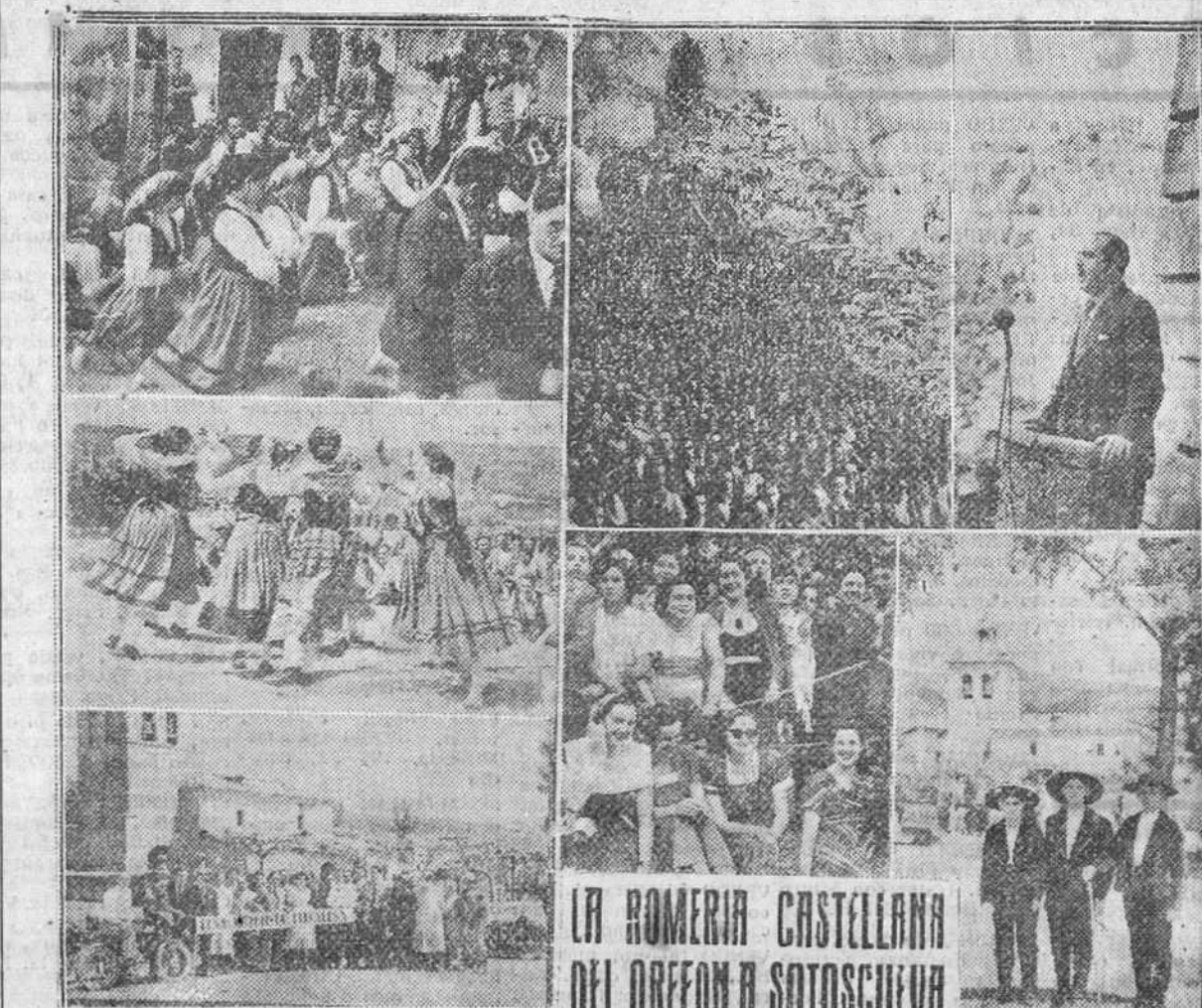
REPORTAJE GRAFICO DE "FEDE" RECOGIENDO DIVERSOS MOMENTOS DE LA BRILLANTISIMA ROMERIA CASTELLANA CELEBRADA EL DOMINGO ULTIMO EN LA MERINDAD DE SOTOSCUEVA

El vecindario, a pesar de la desgracia que colectivamente sobre el pueblo trabaja con tesón y en la medida de sus fuerzas, para remediar los daños causados por esta imponente tormenta, cuya magnitud no tiene precedentes en el recuerdo de ningún nacido de la localidad y que en el espacio de tres horas ha llevado la ruina a dos pueblos y, de modo especial, a Valmala, que es donde con más furia y saña descendió la tormenta.