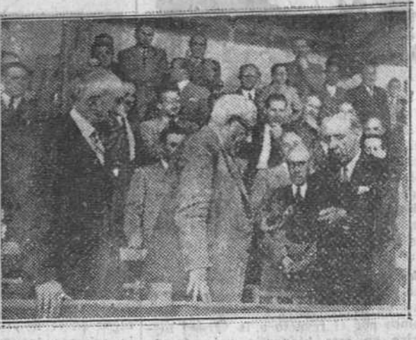
(Información en tercera página).

Con motivo de la entrega de trofeos a los 28 equipos de fútbol participantes en el reciente Torneo "Primavera", fue dedicado el domingo último un brillante y cariñoso homenaje de los deportistas burgaleses al teniente general Yague, infatigable protector del deporte en esta ciudad. En nuestro grabado, el momento en que D. José Moliner, delegado de la Federación Guipuzcoana en Burgos, entrega al glorioso soldado un album con las fotografías de los equipos participantes en el aludido torneo.