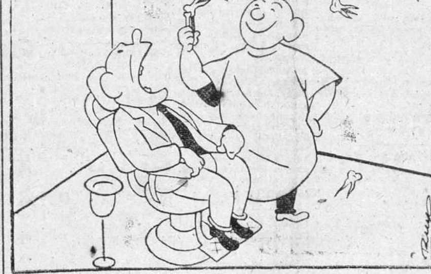
—Me quiere, no me quiere, me quiere...