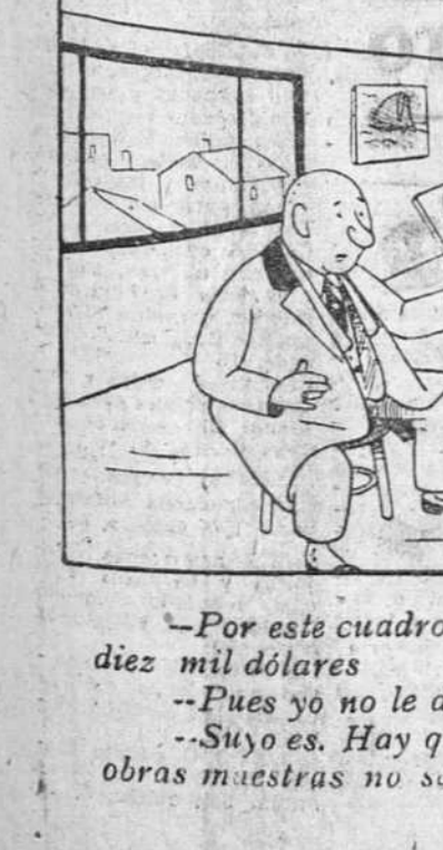
—Por este cuadro, un norteamericano me ofreció diez mil dólares —Pues yo no le daría más de diez duros —Suvo es. Hay que procurar, sobre todo, que las obras maestras no salgan de España

En las cuestiones internacionales, mantendrán una firme actitud contra cualquier tentativa que afecte a la posición de Gran Bretaña en el Mundo. "Pero siempre estaremos dispuestos —declaran— a cooperar plenamente con la Unión Soviética, así como con cualquier otro país que esté preparado para laborar con nosotros en bien de la paz y de la amistad".—Efe.