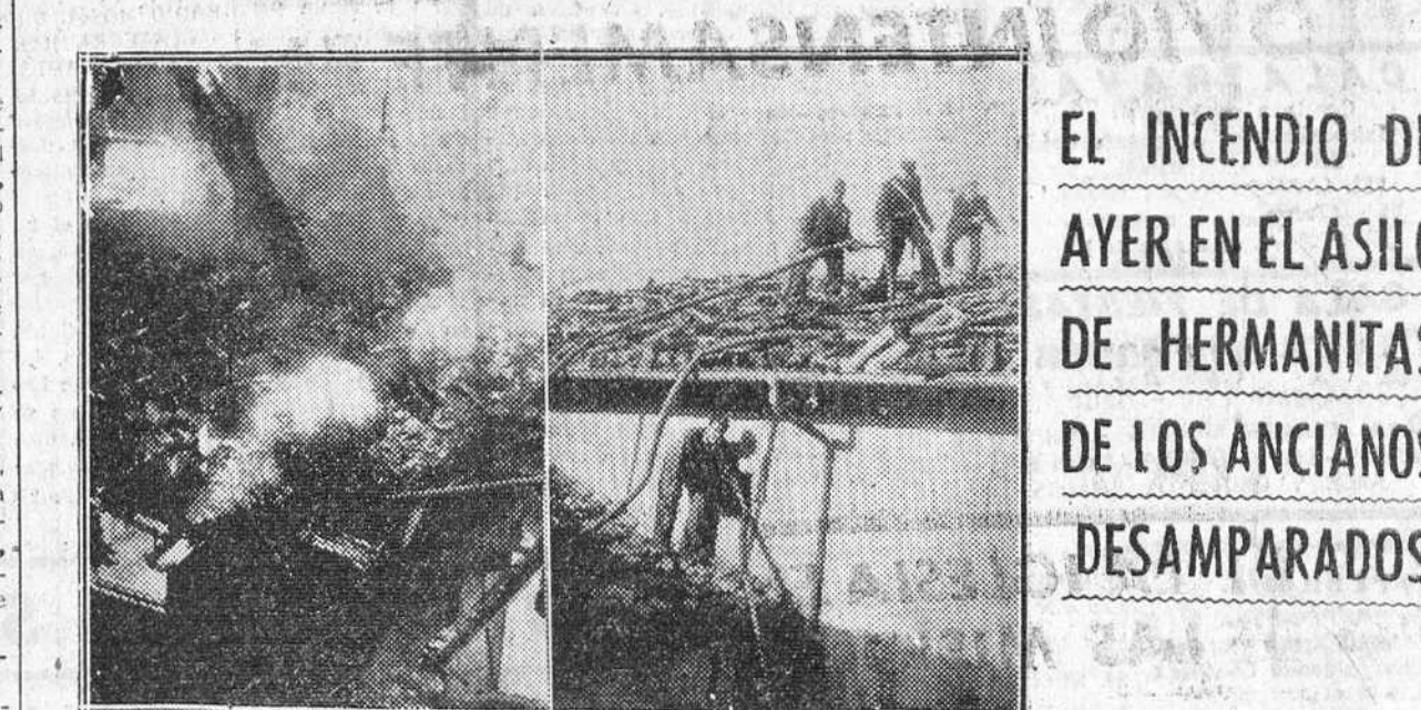
REPORTAJE GRAFICO DE "FEDE" SOBRE EL INCENDIO REGISTRADO AYER EN EL ASILO DE HERMANITAS. De arriba abajo y de izquierda a derecha: aspecto que ofrecía el foco principal del siniestro; los bomberos y guardias municipales, en el tejado del edificio; y dos detalles del pabellón después de sofocado el incendio.

Saigón. — Los Terceros del Vietnam han realizado actos de sabotaje en el territorio Hanoi-Haiphong, cerca de Haidong. En el Vietnam central, los aviones franceses han bombardeado instalaciones de los rebeldes cerca del puerto de Donghoi, destruyendo una gran emisora del Vietminh. En el mismo sector, fuerzas francesas y vietnamitas se han apoderado de dos toneladas de municiones de los rojos. Cerca de Tsurane, también en el Vietnam central, los rebeldes han atacado un puesto francovietnamita y después de dos horas de lucha han sido rechazados con cuantiosas bajas; parece que los rojos no tuvieron merced ni heridos.