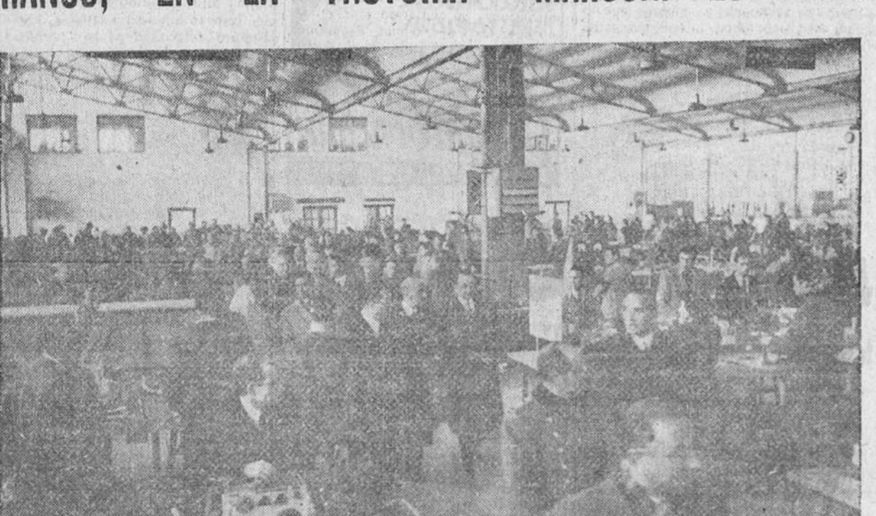
SU EXCELENCIA EL JEFE DEL ESTADO HA VISITADO, ENTRE OTRAS INDUSTRIAS, LA IMPORTANTE FACTORIA DE "MARCONI ESPAÑOLA S. A."...