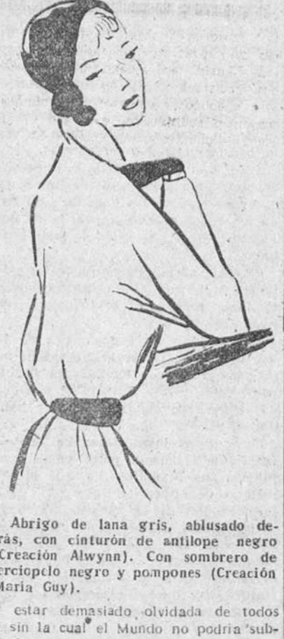
Abrijo de lana gris, ablusado de... (Creación Alwynn)