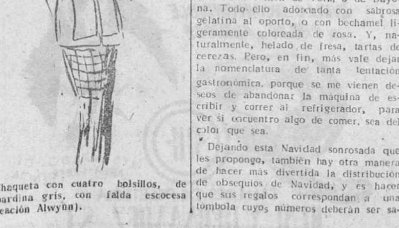
Chaqueta con cuatro bolsillos, de gabardina gris, con falda escocesa (Creación Alwynn)